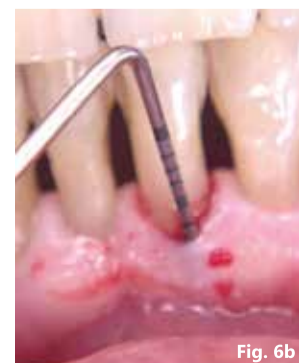
Fig. 6a, 6b - Sondaggio dopo terapia causale.