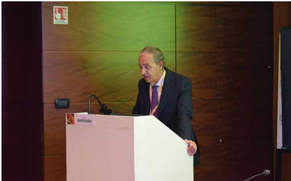
Il dott. Enrico Ciccarelli durante la sua relazione al Congresso SIOF di Siena.

Riguardo soprattutto il tratto ossessivo-compulsivo (ma non solo), il rischio è quello di “scontentare” in ogni caso il paziente che non vede raggiunta quella perfezione che si sarebbe aspettato dal medico. Proprio per questo e ancor di più in questo ambito, è molto importante l'acquisizione di un consenso informato il più dettagliato possibile. Il consenso non