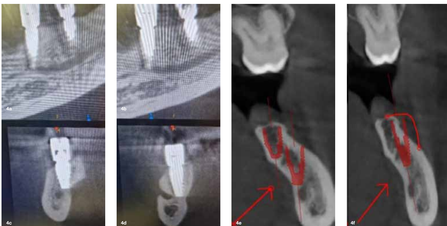
Slika 4a, 4b, 4c, 4d, 4e in 4f: 3D prikaz trdih tkiv.