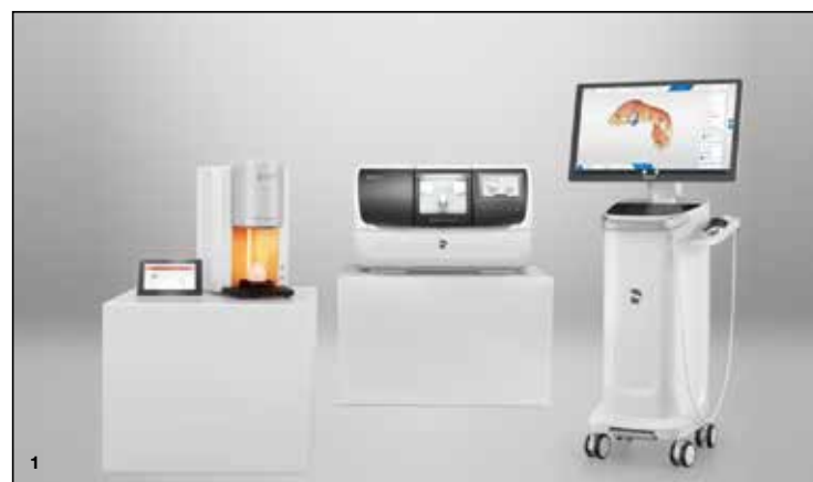
Slika 1: CEREC sistem za izdelavo zobnih restavracij.

Več informacij o CEREC lahko najdete na dentsplysirona.com .