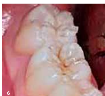
Slika 6: Ko smo odstranili štempljiko, se je nemudoma pokazala lepo oblikovana okluzalna anatomija.