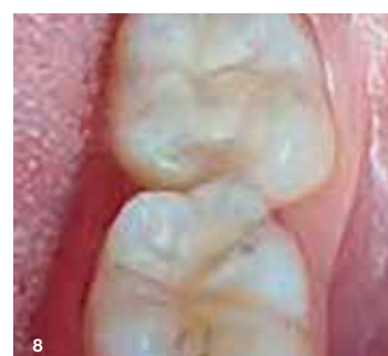
Slika 8: Končni rezultat, preprosto dosežen brez potrebe po oblikovanju ali poliranju.