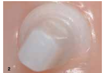
Slika 2: Mukozno-integrirana implantata whiteSKY Alveo Line 6 mesecev po namestitvi.