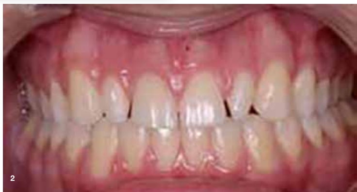
Slika 2: Stanje pred restavracijo.