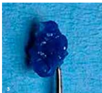
Slika 3: Štempljika natančno posnema okluzalno anatomijo.