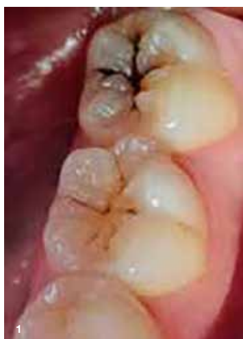
Slika 1: Kariozne lezije brez kavitet na zobeh 46 in 47. Sivkasta sklenina in prekomerna občutljivost na zobu 47 sta kazali na skrito dentinsko lezijo, ki je zahtevala restavracijsko zdravljenje.

Steklohibridne restavracije v zobozdravstvu prinašajo številne prednosti. So biokompatibilne in ne zahtevajo aplikacije veziv za adhezijo ali protokolov absolutne izolacije. Zaradi visoke viskoznosti in kemičnih značilnosti jih lahko nanašamo v večjih količinah, ne glede na globino kavitete, in se izognemo vmesnim fazam. Prav tako jih je z instrumentom ali štempljiko mogoče enostavno oblikovati (kot bomo videli v predstavljenem primeru). In ne nazadnje, stroškovna učinkovitost tega razreda materialov celo pri restavracijah nosilnih posteriornih zob je pritegnila pozornost strokovne literature 1 .