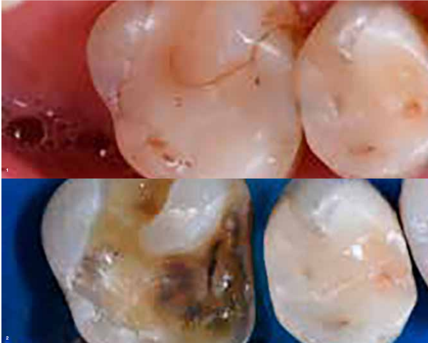
Slika 1 in 2: Izbral bom željeni implantat iz knjižnice softverja in ga virtualno pozicioniral.