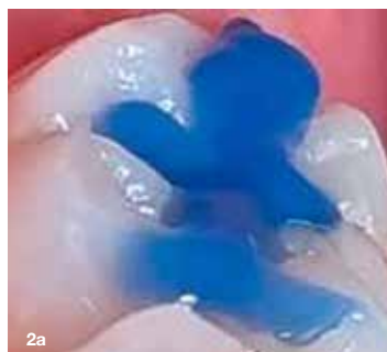
Slika 2a, 2b in 2c: Anatomijo okluzalne površine smo preslikali s smolnatim materialom ter ustvarili štempljiko. Ročaj smo pridobili tako, da smo dodali instrument s kroglico in ga zalili.

EQUIA Forte HT je najnovejši material v tej kategoriji. Sestavljen je iz visoko reaktivnih, površinsko obdelanih fluoroaluminosilikatnih steklenih delcev in poliakrilne kisline z visoko molekularno težo. Porazdelitev velikosti delcev je