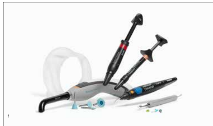
Slika 1: Ivoclar produkti za optimizirano vzajemno delovanje posteriornih restavracijskih delovnih postopkov.

Danes imamo končno popolnoma koordinirane sisteme izdelkov, kakršen je Ivoclarov Efficient Esthetic Workflow, ki ponuja na produktih osnovane rešitve, optimizirane za vzajemno delovanje, ki omogoča poenostavitev posteriornih restavracijskih delovnih postopkov. Delovni postopek prispeva k skrajšanju časa, ki ga pacient preživi na stolu, hkrati pa poskrbi za največjo možno estetiko naših restavracij. Kompozitni materiali, kot sta Tetric PowerFill in Tetric PowerFlow, so bili preoblikovani, tako da se strjujejo hitreje in trše, ne da bi nanje vplivale sile krčenja, ki povzročajo občutljivost in lomljenje na robovih. Nova polimerizacijska tehnologija, ki odlikuje polimerizacijsko lučko Bluephase PowerCure, gre z roko v roki s kompozitom Tetric PowerFill in Tetric PowerFlow. Enojni 4-milimetrski sloj teh kompozitov strdi v samo 3 sekundah in vam prihrani dragocen čas. Nova univerzalna tehnologija barv zoži izbiro na tri barvne odtenke v kompozitni družini, kar omeji vašo izbiro. Nelepljivi instrumenti za oblikovanje in poliranje, ki opravijo delo v enem koraku, pospešijo namestitve in zaključno obdelavo končne