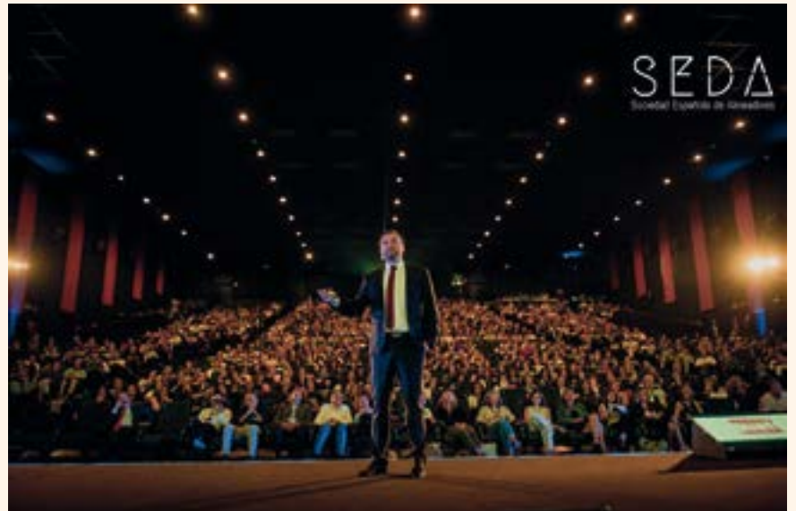
Imagen durante la conferencia del III Congreso SEDA en Madrid.

Siguiendo fieles a nuestros principios, el objetivo de la reunión anual de la Sociedad Española de Alinea-