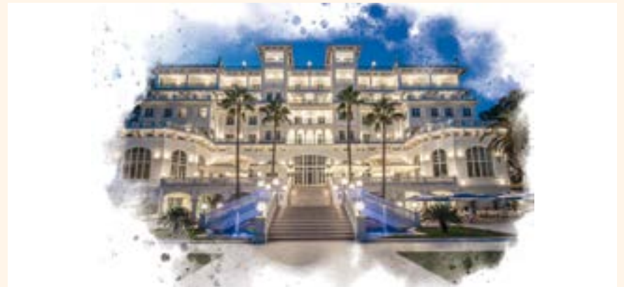
Hotel Miramar Málaga, sede del Simposio Forestadent.

Forestadent tiene como lema "Precisión en nuestros Negocios" para lo cual no sólo realizamos grandes inversiones en tecnología e intentamos mejorar cada día, sino que hemos querido acompañar nuestro diseño de producto con un gran esfuerzo para ser el referente mundial en educación continua, para lo que hemos contratado los ponentes más destacados de