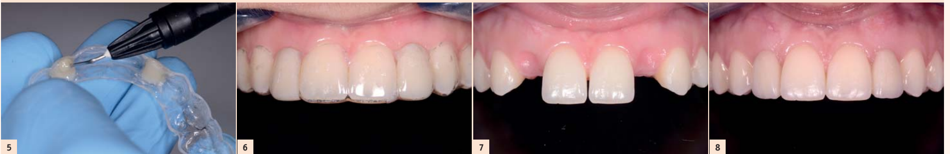
Fig. 5 : Immédiatement après l'intervention de désépithélialisation de la muqueuse, du composite flow est ajouté de façon convexe au niveau de l'intrados des 12 et 22 afin de comprimer les zones cruentées.