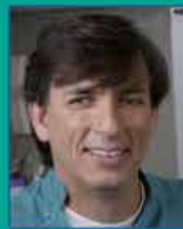
פרופ' עמי שמידט