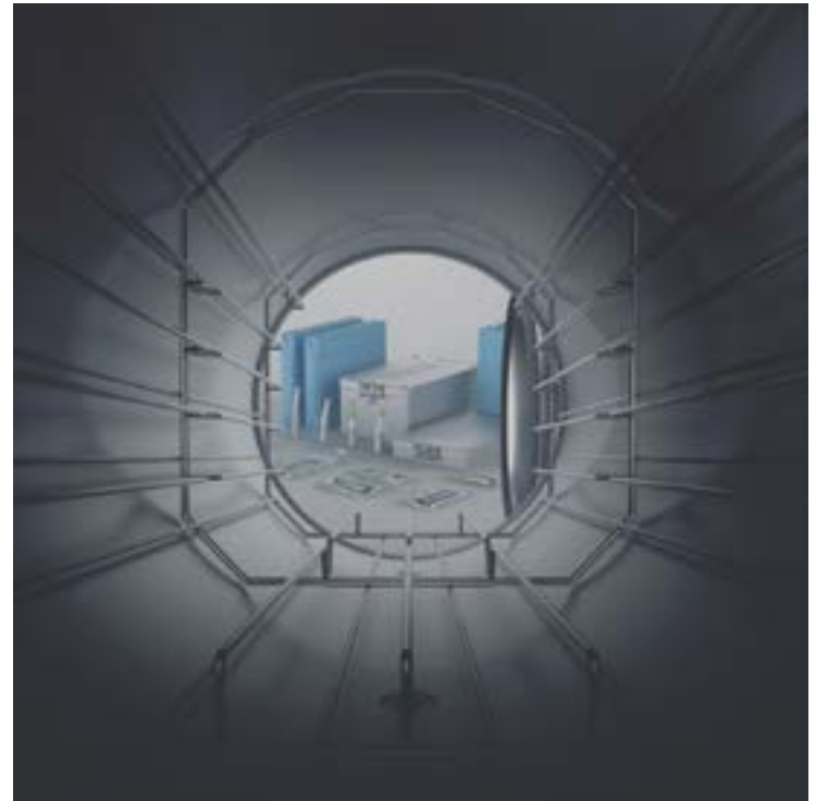
La cámara de 38 litros ofrece el máximo espacio, lo que permite procesar 10 kg de instrumentos embolsados y 12 kg en cajas de esterilización y recipientes.

El nuevo esterilizador Lara XXL sorprende en el día a día de la clínica por su máxima capacidad de hasta 12 kilos de instrumentos y sus mínimas dimensiones. Con una cámara de 38 litros, la unidad ofrece el máximo espacio convirtiéndose en el esterilizador más grande del fabricante de tecnología médica W&H.