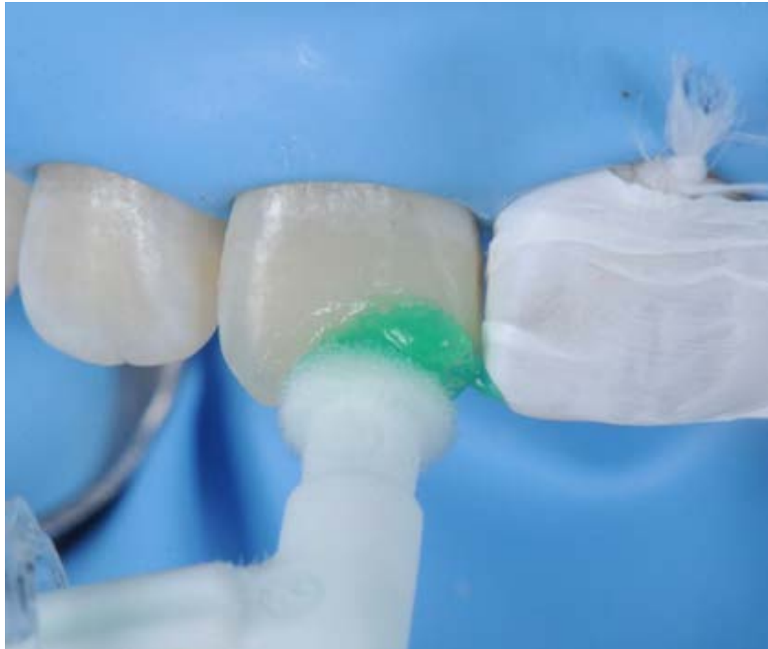
Figura 1. La imagen muestra la aplicación de ICON etch (ácido clorhídrico al 15%) para eliminar esmalte aprismático y abrir porosidades del esmalte, tema del que hablará el Dr. Pesaressi en su conferencia.

Considero que la OMI se ha desarrollado mucho durante la última década y se ha producido mucha evidencia para introducirla de manera confiable en nuestra práctica clínica. Las dos conferencias siguen una secuencia lógica: para la primera se plantea la premisa de postergar lo máximo posible la primera intervención operatoria, ya que sabemos que todos los materiales restauradores tienen un tiempo de vida limitado, y usualmente el fracaso se debe a caries secundaria. Y para la segunda, sabiendo que en pacientes de alto riesgo de caries la tasa de sobrevida del tratamiento restaurador es menor, puede que sea más conveniente optar por materiales que presenten la denominada característica de 'bioactividad', promoviendo una interacción