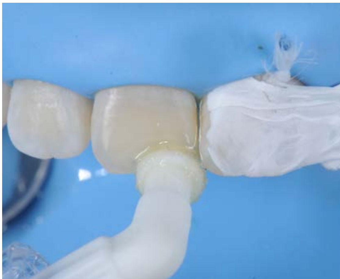
Figura 2. El experto peruano describirá la técnica para ocupar espacios interprismaticos y camuflar la opacidad del esmalte utilizando ICON Infiltrant (resina sin relleno con TEGDMA).

“La conferencia sobre Odontología de Mínima Intervención plantea la premisa de postergar lo máximo posible la primera intervención operatoria, ya que sabemos que todos los materiales restauradores tienen un tiempo de vida limitado”.