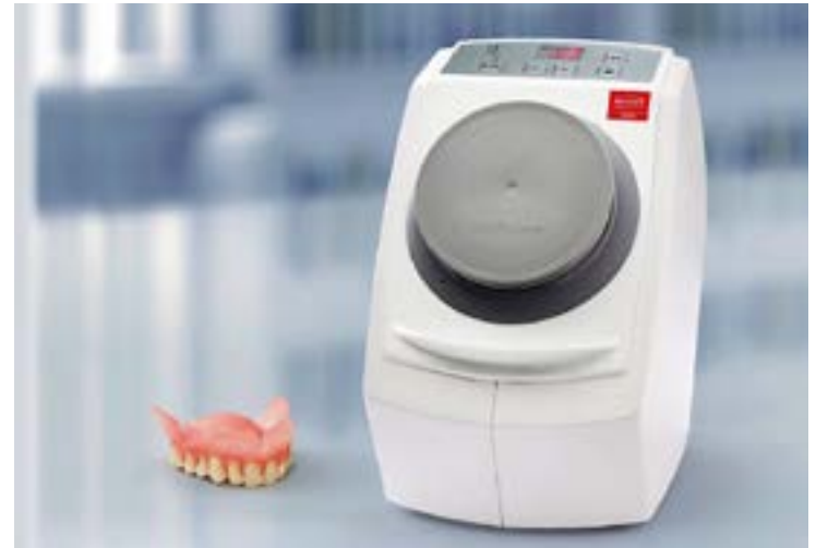
El aparato para la limpieza de prótesis en el consultorio SYMPRO ayuda a la salud del paciente y a la fidelización del cliente.