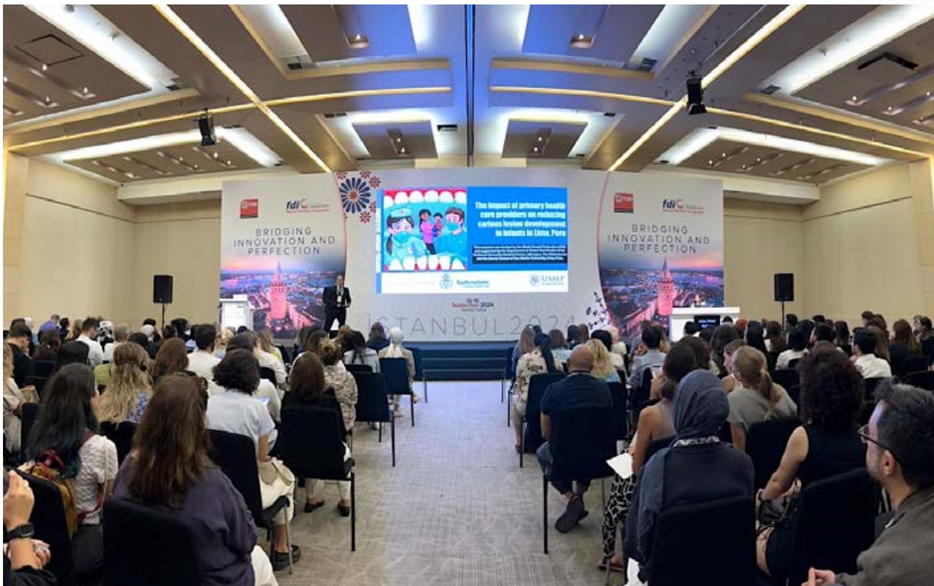
El Dr. Eraldo Pesaressi Torres, que fue ponente del Congreso Mundial de FDI 2024 en Estambul, dictará dos conferencias en el Congreso Regional de las Américas, que tendrá lugar del 15 al 17 de mayo en en Costa Rica.