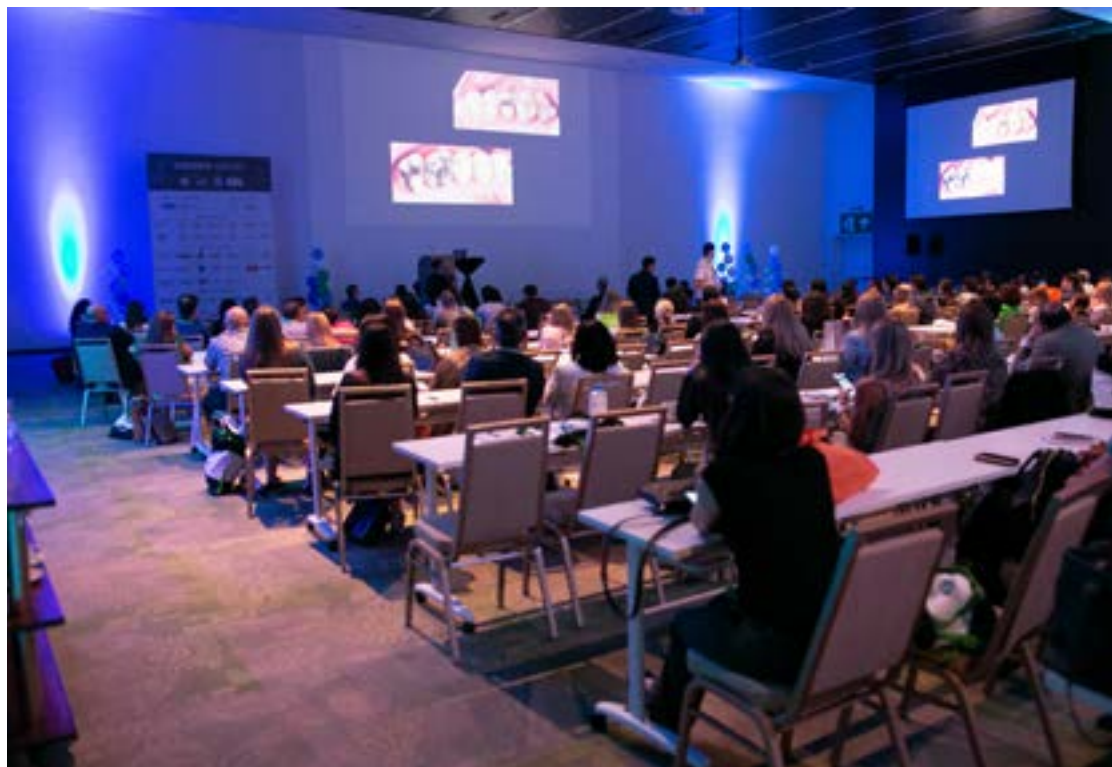
Imagen del Congreso Internacional Odontológico de Costa Rica, que en esta ocasión se celebrará conjuntamente con el FDI Regional Congress 2025 del 15 al 17 de mayo, en San José.