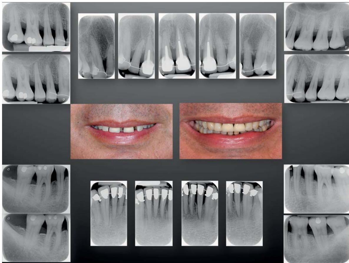
Patiente 40 ans – Parodontite sévère - Prédilection, stress

– Adult Orthodontics. Birte MELSEN, Ed. Wiley – Blackwell. 2012. – Parodontologie & dentisterie implantaire. Philippe BOUCHARD. Ed. Lavoisier Médecine sciences. 2016.