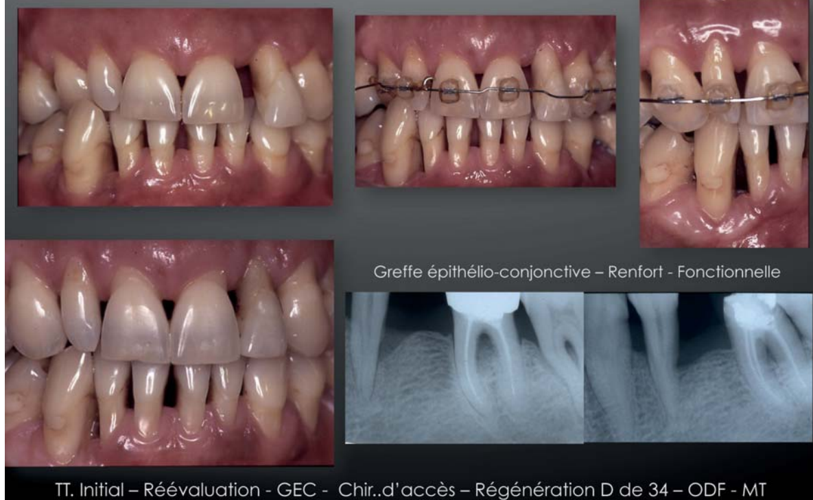
Grefe épithélio-conjonctive – Renfort - Fonctionnelle