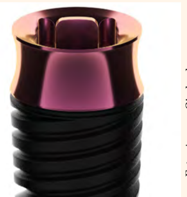
El nuevo implante matrix, que no necesita pilar, de TRI Dental Implants.

Amann Girschbach tiene en TRI Dental Implants, empresa que ha desarrollado los implantes de la línea matrix, el socio perfecto en la fabricación de las restauraciones. Amann Girschbach es proveedor de sistemas de soluciones CAD/CAM para el laboratorio y la clínica, y permite emplear flujos de trabajo validados con un máximo de eficiencia y seguridad. En el proyecto con TRI Dental Implants, además de una exhaustiva valoración de los procesos del software y de la maquinación, también se han validado diferentes materiales. En el futuro será posible, por ejemplo, fabricar coronas de alta precisión con Zolid DRS o Zolid Gen-X directamente sobre el implante, sin pérdidas en la función o en la estética. En combinación con el horno de