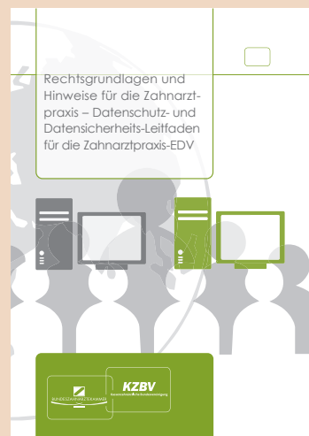
Der Datenschutzleitfaden der Bundeszahnärztekammer und der Kassenzahnärztlichen Bundesvereinigung informiert über das neue Datenschutzrecht.