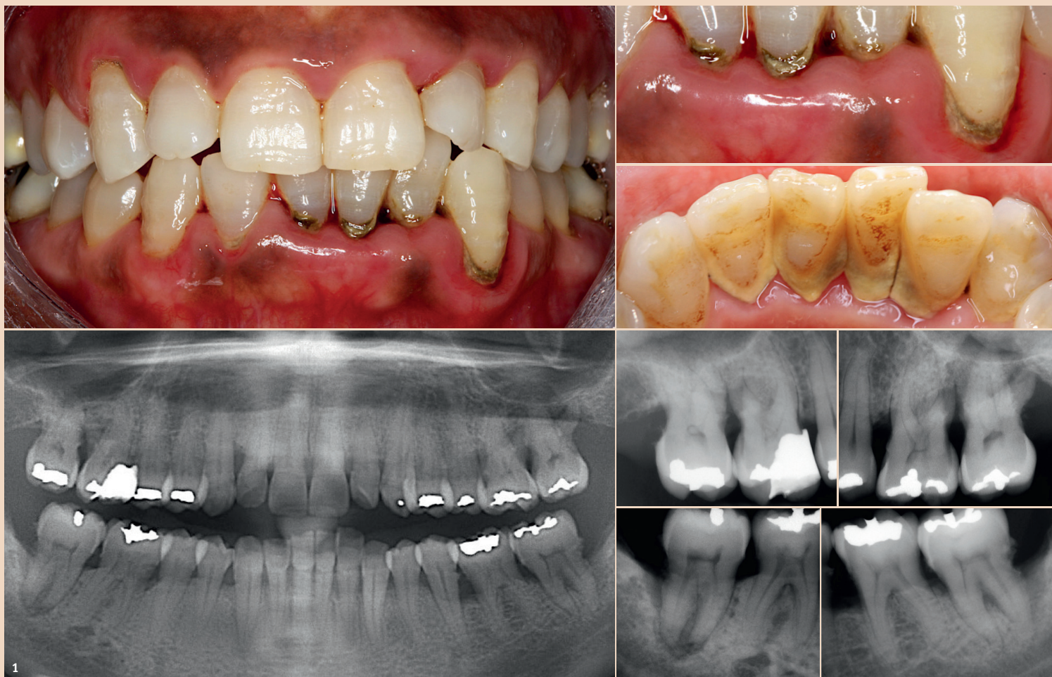
Abb. 1: 47-jährige Patientin mit generalisierter chronischer Parodontitis gravis et complicata. Plaque-, Zahnstein- und Konkrementablagerungen im supra- und subgingivalen Bereich sind auf den klinischen und radiologischen Bildern deutlich erkennbar und als ätiologischer Faktor für das Entstehen der Parodontitis anzusehen.

Lokal verabreichte Produkte im Rahmen der nichtchirurgischen Parodontaltherapie zielen auf eine bessere Infektionskontrolle, reduzierten Gewebeerstörung und/oder eine verbesserte Wundheilung ab. Dies sollte klinisch in einer größeren Reduktion der Sondierungstiefe, in einem zusätzlichen Gewinn an Attachment sowie in einer verbesserten radiologischen Knochendefektheilung resultieren. Beispielsweise wies die lokale Applikation von Hyaluronsäure als Ergänzung zur nichtchirurgischen Parodontaltherapie zwar einen zusätzlichen Effekt bei der Sondierungstiefenreduktion von 0,2 bis 0,9 mm auf, aber nur einen begrenzten zusätzlichen Effekt im Hinblick auf Attachmentlevel-Gewinn. 11 Betrachtet man die Ergebnisse diverser Übersichtsarbeiten, zeigt sich generell für nichtantibiotische Zusätze im Rahmen der nichtchirurgischen Parodontaltherapie ein zusätzlicher Effekt von 0,2 bis 0,9 mm und 0,1 bis 0,9 mm in Bezug auf Sondierungstiefenreduktion beziehungsweise Attachmentlevel-Gewinn (Chlorhexidin 12,14 , Povidon-Iod 48 , niedrig dosiertes Doxycyclin 49 , Probiotika 15 , diverse Produkte 50 ). Der zusätzliche Effekt nach Statin-Applikation in Bezug auf Sondierungstiefenreduktion, Attachmentlevel-Gewinn