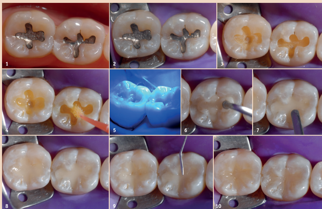
Abb. 1: Zähne 46 und 47, deren Amalgamfüllungen aus ästhetischen Gründen ersetzt werden sollen. – Abb. 2: Trockenlegung mit Kofferdam. – Abb. 3: Präparierte Kavitäten der Klasse I. – Abb. 4: Aufbringen des Adhäsivsystems Futurabond DC (VOCO). – Abb. 5: Photopolymerisation der Adhäsivschicht für zehn Sekunden. – Abb. 6 bis 9: Kavitäten wurden mit jeweils einem einzigen Inkrement gefüllt. Ohne Zwischenhärtung dieser Inkremente wurden die Okklusalfächen mit feinen Spateln und Sonden modelliert. Anschließend wurden die Füllungen jeweils 20 Sekunden lang photopolymerisiert. – Abb. 10: Mittels einer feinen Sonde wurden okklusale Fissuren modelliert.

Gefragt sind innovative Materialien mit Leistungsfähigkeit und Ästhetik. Von Dr. Sanzio Marques, Belo Horizonte, Brasilien.