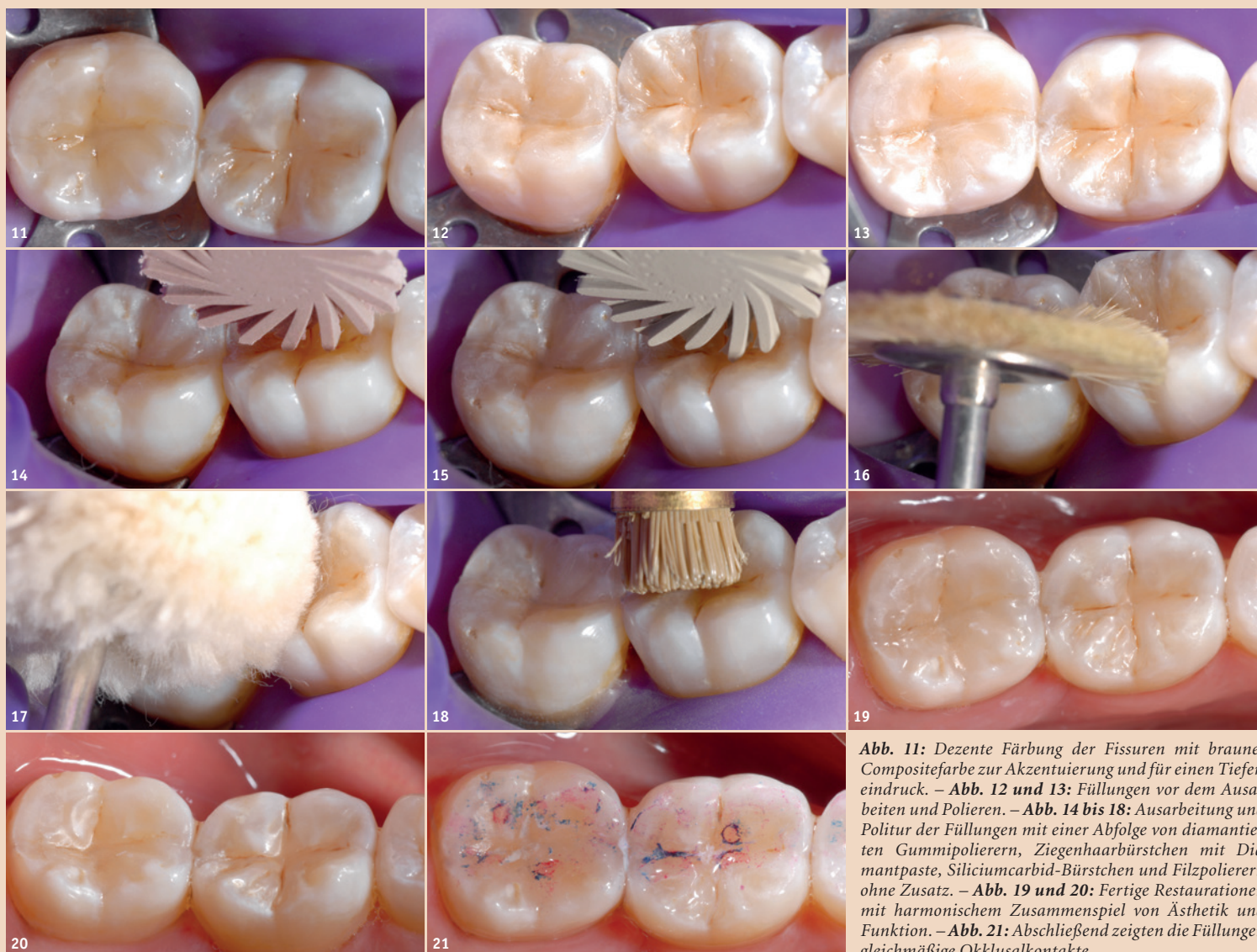
Abb. 11: Dezente Färbung der Fissuren mit brauner Compositefarbe zur Akzentuierung und für einen Tiefeneindruck. – Abb. 12 und 13: Füllungen vor dem Ausarbeiten und Polieren. – Abb. 14 bis 18: Ausarbeitung und Politur der Füllungen mit einer Abfolge von diamantierten Gummipolierern, Ziegenhaarbürstchen mit Diamantpaste, Siliciumcarbid-Bürstchen und Filzpolierern ohne Zusatz. – Abb. 19 und 20: Fertige Restaurationen mit harmonischem Zusammenspiel von Ästhetik und Funktion. – Abb. 21: Abschließend zeigten die Füllungen gleichmäßige Okklusalkontakte.

Belo Horizonte, Brasilien sanzio@sorrisobelo.com.br www.sorrisobelo.com.br