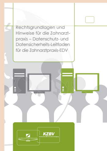
Der Datenschutzleitfaden der Bundeszahnärztekammer und der Kassenzahnärztlichen Bundesvereinigung informiert über das neue Datenschutzrecht.