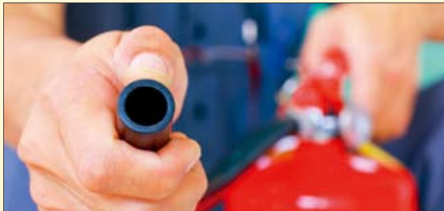
预防火灾远比从火灾中恢复要容易的多。