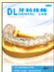
《牙科技师》 (2018年更名为《数字化牙科》)