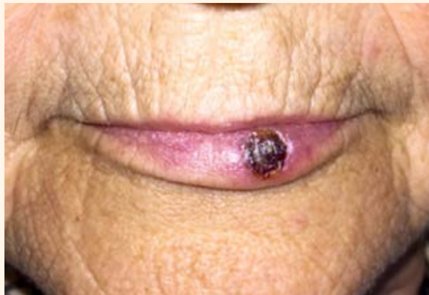
Figura 3. Aspecto de la lesión inmediatamente después del tratamiento.