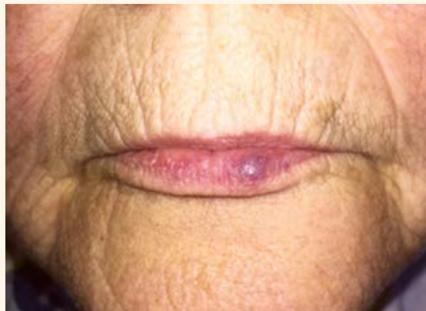
Figura 1. Manifestación clínica de VVM en el lado izquierdo del labio inferior.

Una paciente sana de edad avanzada se presentó en nuestra consulta con una hinchazón localizada, redondeada, elevada, indolora, azulpúrpura en el lado derecho del labio inferior, que medía 5x5 mm y se vaciaba con presión (Fig. 1). Estuvo presente durante un largo período de tiempo sin causar complicaciones. En los dos últimos meses se