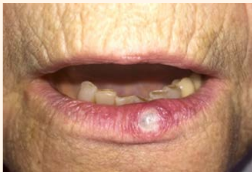
Figura 4. Aspecto de la lesión una semana después del tratamiento.