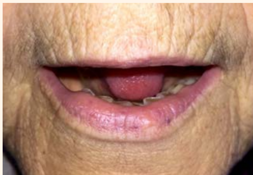
Figura 5. Desaparición total de la lesión 3 meses después de la fotocoagulación.