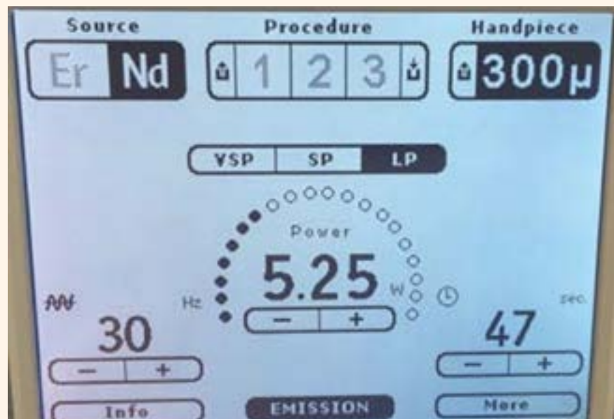
Figura 2. Parámetros del láser para el tratamiento de fotocoagulación.