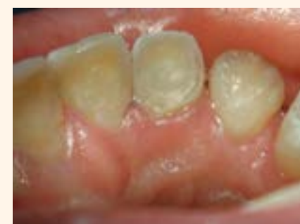
Figura 1. Aspectos clínico y radiográfico del diente 12.