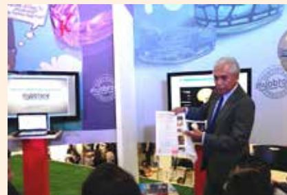
Uciatempus pos aturibusdam nes dolut omnim dolut aut molest, quis deliasped erorers pernati atioresciet ma inctati untotat escimetur velitior