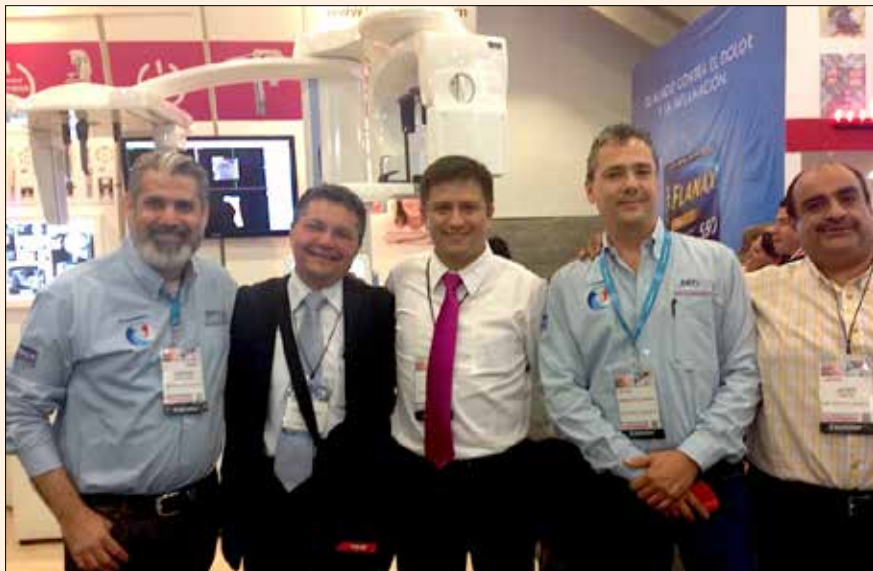
Everepuditisi ventiuunt laut a doluptinullo omnim alique quo il id quaecae lac- cum que explissiti aci unt utam corruptasit moluupti solestiam eari