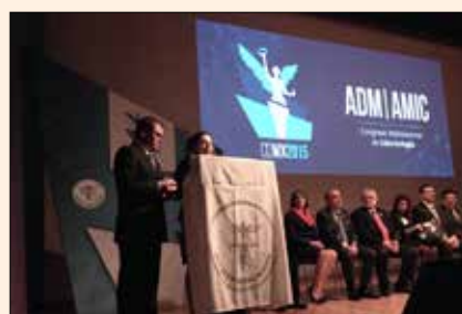
La ceremonia de juramentación fue presentada por la filial de ADM en Nuevo León.