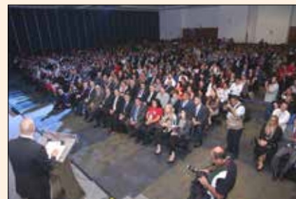
Everepuditisi ventiunt laut a dolupti-nullo omnim alique quo il id quaecae laccum que explissiti aci unt utam corruptasit molupti solestiam eari