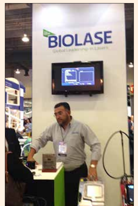
Uciatempos pos aturibusdam nes dolut omnim dolut aut molest, quis ma inctati untotat escimetur velitior