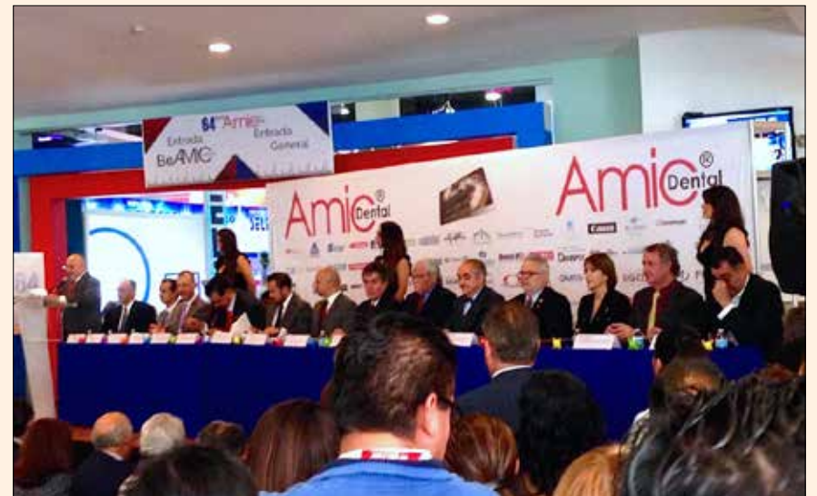
Everepuditisi ventiuunt laut a doluuptinullo omnim alique quo il id quaecae lac- cum que explissiti aci unt utam corruptasit moluupti solestiam eari