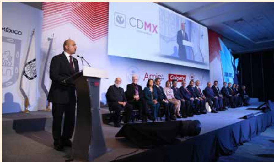
Uciatempos pos aturibusdam nes dolut omnim dolut aut molest, quis deliasped erorers pernati atioresciet ma inctati untotat escimetur velitior