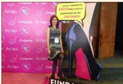
Uciatempos pos aturibusdam nes dolut omnim dolut aut molest, quis deliasped erorers pernati atioresciet ma inctati untotat escimeture velitior