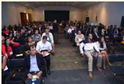
Everepuditisi ventiunt laut a dolupti-nullo omnim alique quo il id quaecae laccum que explissiti aci unt utam corruptasit molupty solestiam eari