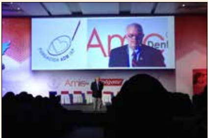
Everepuditisi ventiunt laut a dolupti-nullo omnim alique quo il id quaecae corruptasit molupty solestiam eari