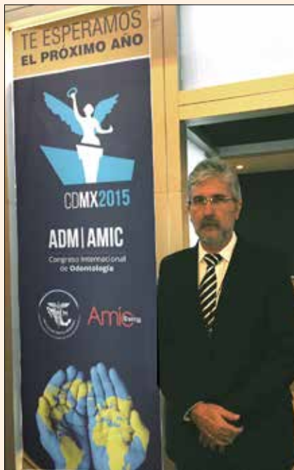
Uciatempos pos aturibusdam nes dolut omnim dolut aut molest, quis ma inctati untotat escimetur velitior