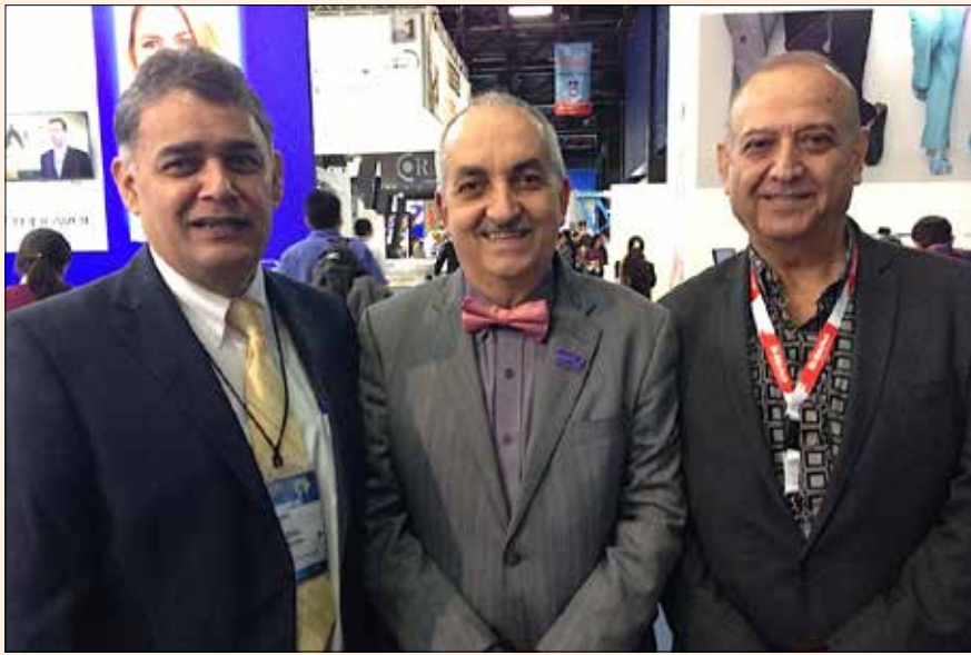
Everepuditisi ventiunt laut a doluptinullo omnim alique quo il id quaecae lac-cum que explissiti aci unt utam corruptasit molupty solestiam eari