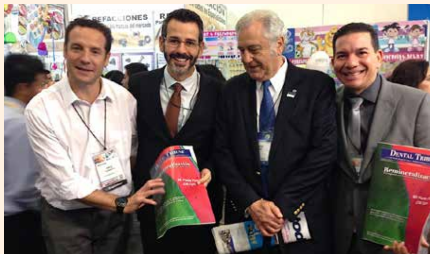
Uciatempos pos aturibusdam nes dolut omnim dolut aut molest, quis deliasped erorers pernati atioresciet ma inctati untotat escimetur velitior