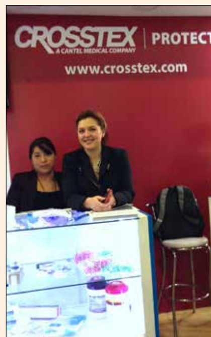
Uciatempos pos aturibusdam nes dolut omnim dolut aut molest, quis ma inctati untotat escimetur velitior