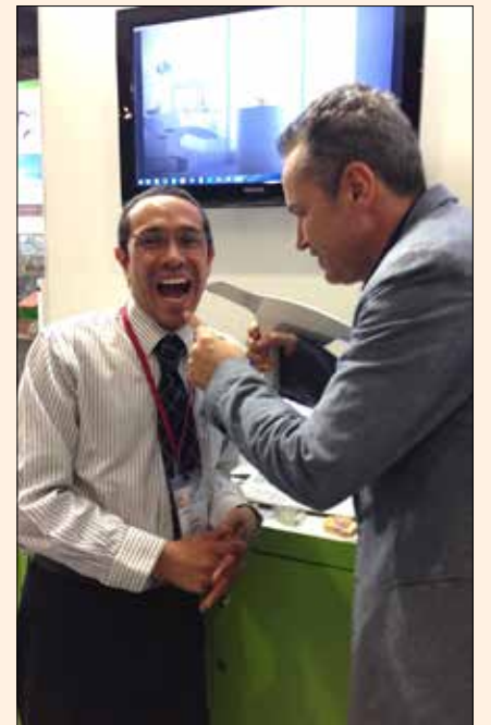
Uciatempus pos aturibusdam nes dolut omnim dolut aut molest, quis ma inctati untotat escimetur velitior