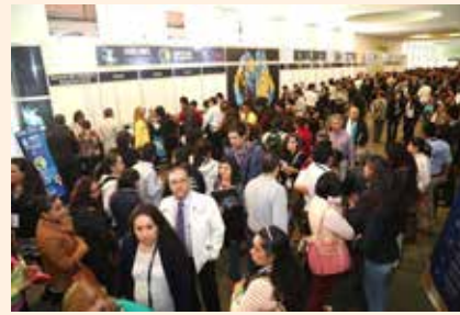
Uciatempos pos aturibusdam nes dolut omnim dolut aut molest, quis deliasped erorers pernati atioresciet ma inctati untotat escimetur velitior