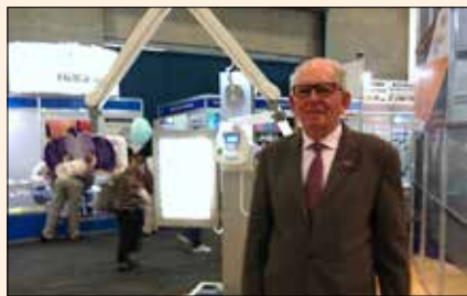
Uciatempos pos aturibusdam nes dolut omnim dolut aut molest, quis ma inctati untotat escimetur velitior