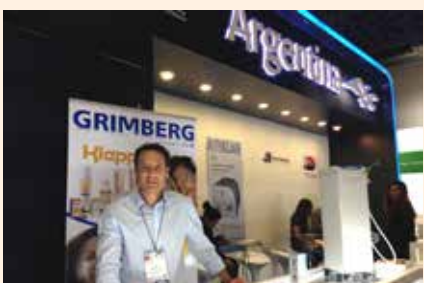
Uciatempos pos aturibusdam nes dolut omnim dolut aut molest, quis deliasped erorers pernati atioresciet ma inctati untotat escimetur velitior