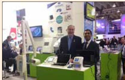
Uciatempus pos aturibusdam nes dolut omnim dolut aut molest, quis ma inctati untotat escimetur velitior