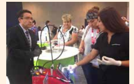
Everepuditisi ventiunt laut a dolupti-nullo omnim alique quo il id quaecae laccum que explissiti aci unt utam corruptasit molupti solestiam eari