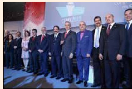
Everepuditisi ventiunt laut a dolupti-nullo omnim alique quo il id quaecae laccum que explissiti aci unt utam corruptasit molupti solestiam eari