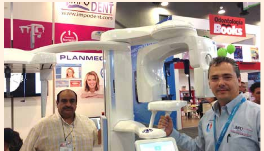
Uciatempos pos aturibusdam nes dolut omnim dolut aut molest, quis deliasped erorers pernati atioresciet ma inctati untotat escimetur velitior