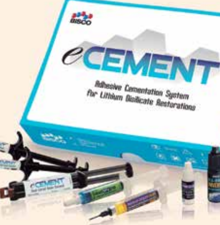
El sistema completo de cementación eCEMENT Kit para restauraciones de disilicato de litio, de Bisco