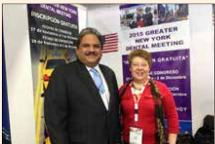
Everepuditisi ventiuunt laut a doluupti- nullo omnim alique quo il id quaecae corruptasit moluupti solestiam eari