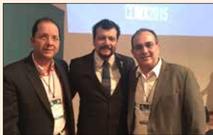
Uciatempos pos aturibusdam nes dolut omnim dolut aut molest, quis ma inctati untotat escimetur velitior