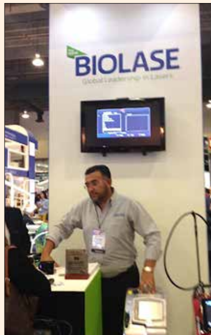
Uciatempos pos aturibusdam nes dolut omnim dolut aut molest, quis ma inctati untotat escimetur velitior