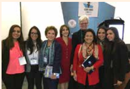
Uciatempos pos aturibusdam nes dolut omnim dolut aut molest, quis deliasped erorers pernati atioresciet ma inctati untotat escimeture velitior