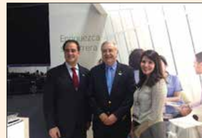
Everepuditisi ventiunt laut a dolupti-nullo omnim alique quo il id quaecae corruptasit molupti solestiam eari