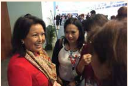
Uciatempos pos aturibusdam nes dolut omnim dolut aut molest, quis deliasped erorers pernati atioresciet ma inctati untotat escimetur velitior