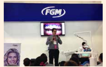
Everepuditisi ventiuunt laut a doluupti- nullo omnim alique quo il id quaecae lac- cum que explissiti aci unt utam corruptasit moluupti solestiam eari