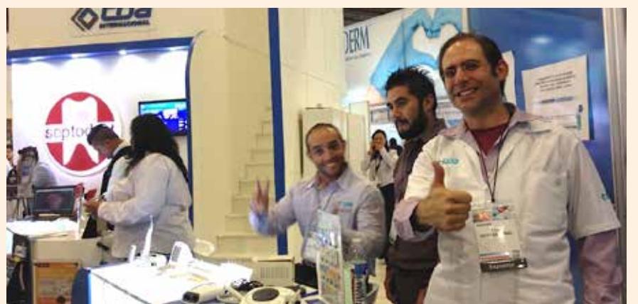
Uciatempus pos aturibusdam nes dolut omnim dolut aut molest, quis deliasped erorers pernati atioresciet ma inctati untotat escimetur velitior