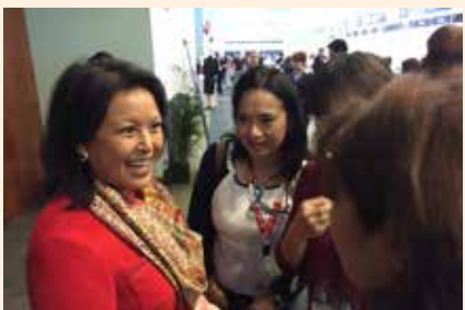
Uciatempos pos aturibusdam nes dolut omnim dolut aut molest, quis deliasped erorers pernati atioresciet ma inctati untotat escimetur velitior