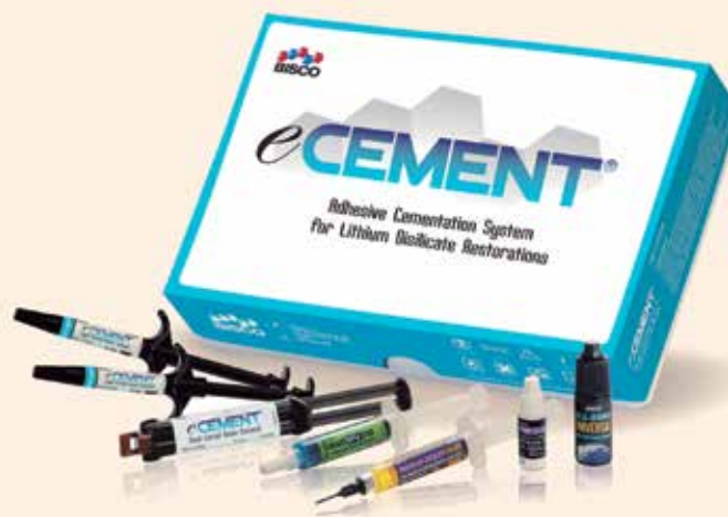
El sistema completo de cementación eCEMENT Kit para restauraciones de disilicato de litio, de Bisco

eCEMENT está diseñado para simplificar la colocación restauraciones de disilicato de litio (como por ejemplo IPS e.max). El disilicato de litio es una cerámica de vidrio a base de sílice disponible en formas prensadas y blanqueadas, con opacidad