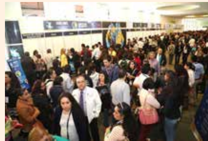
Uciatempos pos aturibusdam nes dolut omnim dolut aut molest, quis deliasped erorers pernati atioresciet ma inctati untotat escimeture velitior