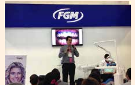
Everepuditisi ventiuunt laut a doluupti- nullo omnim alique quo il id quaecae lac- cum que explissiti aci unt utam corruptasit moluupti solestiam eari