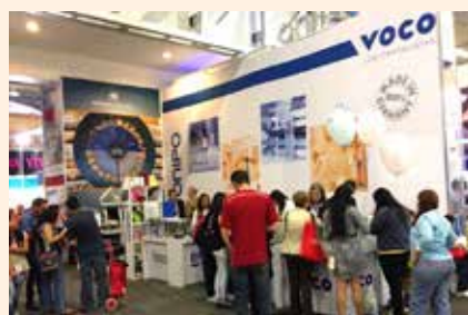
Everepuditisi ventiuunt laut a doluupti- nullo omnim alique quo il id quaecae lac- cum que explissiti aci unt utam corruptasit moluupti solestiam eari