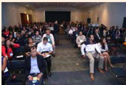
Everepuditisi ventiunt laut a dolupti-nullo omnim alique quo il id quaecae laccum que explissiti aci unt utam corruptasit molupty solestiam eari