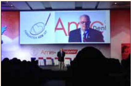
Everepuditisi ventiunt laut a dolupti-nullo omnim alique quo il id quaecae corruptasit molupty solestiam eari