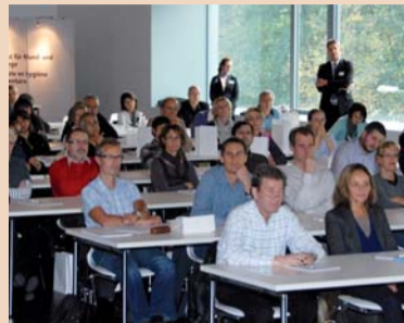
Über 110 Teilnehmer verfolgten die GABA-Fortbildung im Verkehrshaus Luzern.