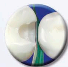
Si inserisce come un cuneo