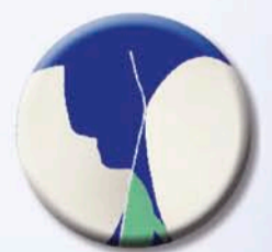
Punto di contatto di forma convessa