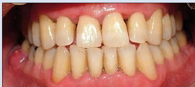
Fig. 1 - Parodontopatia.

È oggi consuetudine primaria diffondere le norme in merito alla disinfezione del cavo orale, visti i rischi di patologia associati alla comparsa di malattie conclamate nel distretto odontostomatologico. In genere è buona regola utilizzare il protocollo di disinfezione orale mediante presidi appropriati, che abbiano come priorità quella di abbassare la carica batterica a una percentuale dell'80%; ciò può essere effettuato mediante delle procedure già sperimentate e standardizzate secondo linee guida precise. In genere, la disinfezione si attua su pazienti affetti da patologie croniche (istoflogosi) come parodontopatie (Fig. 1), ma anche su soggetti affetti da