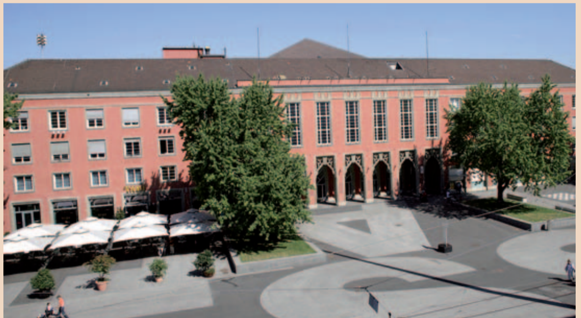
Eingang zur Halle 1 der Messe Basel mit grossem Festsaal. Hier tagt der SSO Kongress. Im selben Gebäude, im Saal Luzern, tagt die SGDMFR, Schweizerische Gesellschaft für Dentomaxillofaziale Radiologie.