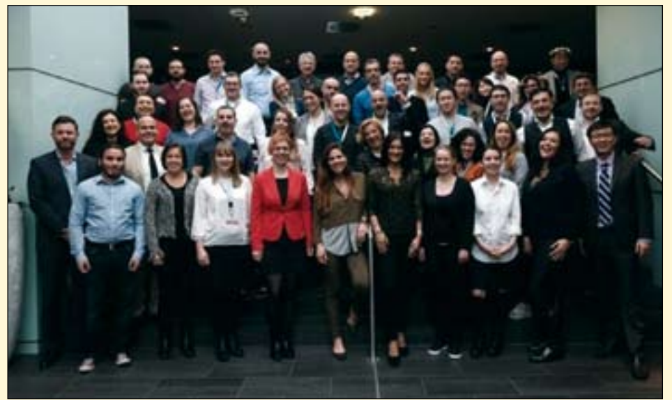
值科隆国际牙科展（IDS）开幕之际，世界牙科论坛（DTI）出版集团成员在第十三届出版人大会上共聚一堂。