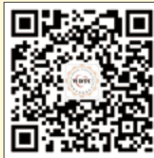
世界牙科论坛微信公众账号