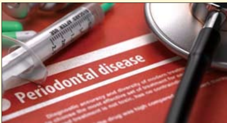
美国研究人员发现, 牙周疾病是导致牙齿脱落和死亡率提升的危险因素之一。

在为时6.7年的随访期当中, 研究人员共记录3589例心血管疾病病例以及3816例死亡病例。同时, 研究人员还发现, 患有或曾患有牙周疾病的受