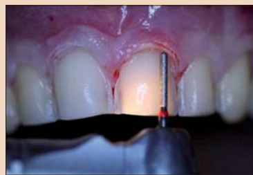
Рис. 6. Препарирование.