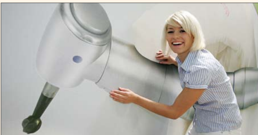
Una modelo alemana posa con uno de los miles de productos que se presentaron en la feria de Colonia (Alemania).

Más de 106,000 visitantes asistieron a esta feria bienal, en la que participaron nada menos que 1,820 expositores, para descubrir las últimas novedades de la industria odontológica internacional. La 33 edición del International Dental Show (IDS) registró importantes aumentos en el número de visitantes (6,9%), expositores (4,5%) y espacio expositivo (6,2%). La participación internacional de un total de 57 países aumentó a un 65% del total, un 10% más que en 2007.