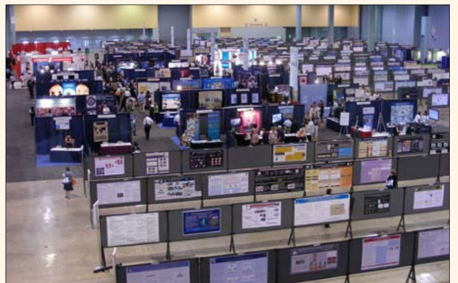
Vista del salón del Centro de Convenciones de Miami donde se exhibieron los carteles de investigación durante el congreso de IADR.

GSK Consumer Healthcare ha contribuido cerca de $1,4 millones a estos prestigiosos premios, que reconocen la investigación en tecnologías innovadoras destinadas a mejorar la salud bucal y la calidad de vida. Cada uno de los tres ganadores recibirá una beca investigación