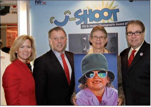
U-Shoot Avrupa Bölgesi kazananları ile FDI ve Wrigley delegeleri birarada.

Dubai'de düzenlenen 2007 FDI yıllık Dünya Dental Kongresi'nde FDI Dünya Dental Federasyonu Wm. Wrigley Jr firması ile 2008 FDI & Wrigley Fotoğraf ödülünü vermek üzere işbirliğine başladı.