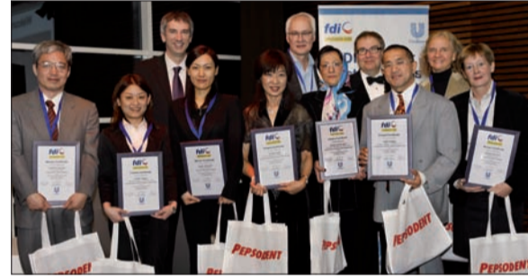
FDI ve Unilever delegeleri ile 2008 poster yarışmasında dereceye girenler bir arada.

uyku apnesinde ağız apareyi ile tedavi sonrası kognitif fonksiyonların geliştirilmesi'