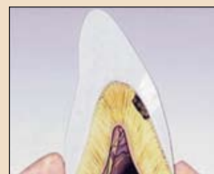
Εικ. 2 Τερηδονική βλάβη με λεία επιφάνεια.