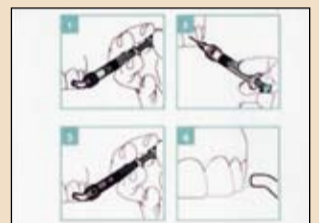
Εικ. 7 Δημιουργία λείας επιφάνειας.

ταλλικοποιημένη αδαμαντίνη μπορεί να εμφραχθεί και να ενισχυθεί χωρίς τρυπανισμό ή αναισθησία (εικ. 4 και 5).