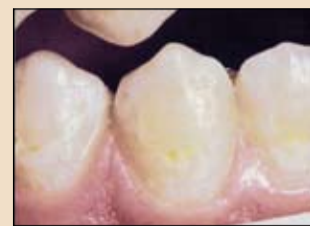
Εικ. 1 Τυπικές λευκές κηλίδες σχήματος C ή ανώμαλον σχήματος.

Ο εξαιρετικά υψηλός συντελεστής διεισδυτικότητας δίνει τη δυνατότητα διείσδυσης στους πόρους της βλάβης. Ακολουθεί η αφαίρεση της περίσσειας του υλικού και ο φωτοπολυμερισμός του. Ο συνολικός χρόνος θεραπείας είναι περίπου 15 λεπτά (εικ. 7). Η αισθητική θεραπεία τερηδονικών λευκών κηλίδων σε μία συνεδρία μπορεί να