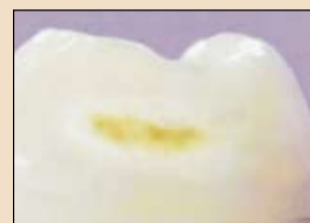
Εικ. 3 Κλινική εικόνα μίας τερηδονικής βλάβης.