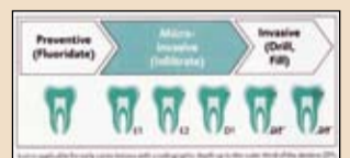
Εικ. 6 Η πρώτη θεραπεία για να γεφυρωθεί το κενό μεταξύ πρόληψης και αποκατάστασης.