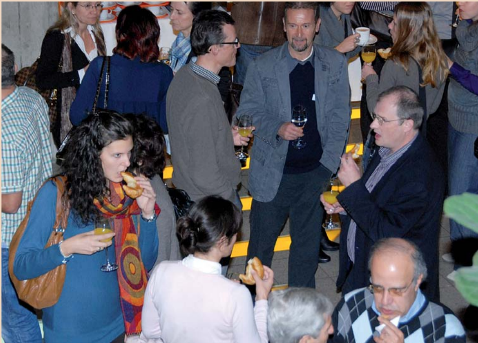
Pause im grosszügigen Foyer der Universität Zürich Irchel.