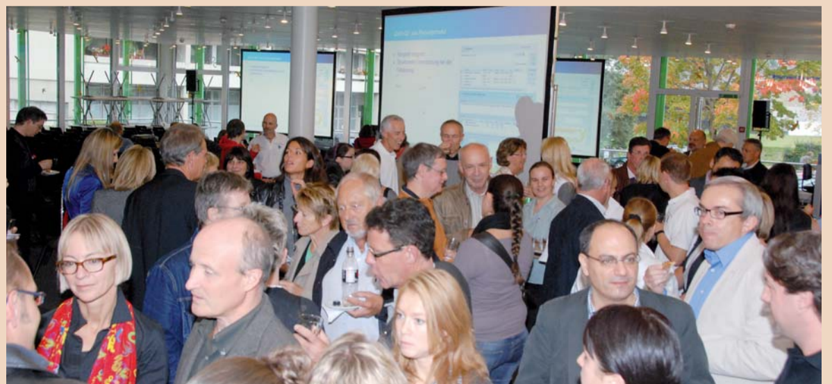
Reger Betrieb beim Apéro der Martin Engineering in der Mettler Toledo-Kantine.