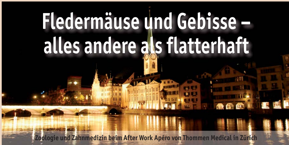
Zoologie und Zahnmedizin beim After Work Apéro von Thommen Medical in Zürich

Nur mit dem Schalldetektor zu hören – ein Riesenspektakel der Fledermäuse über der Limmat.