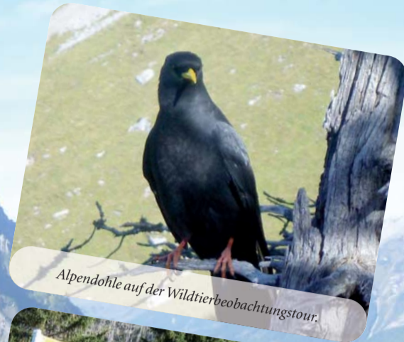
Alpendohle auf der Wildtierbeobachtungstour.