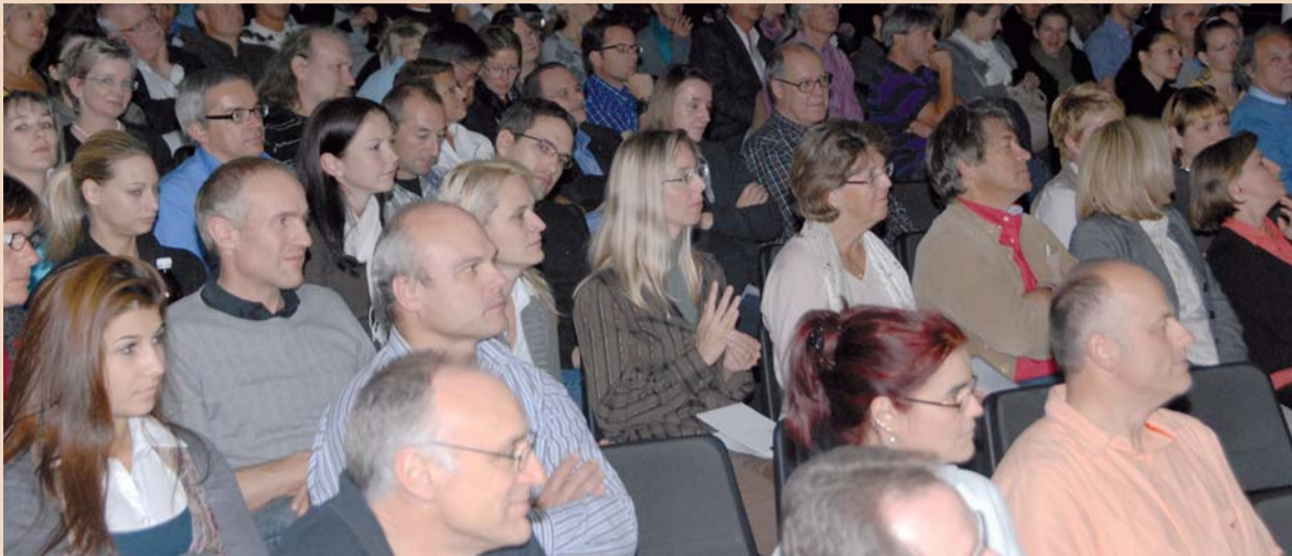
340 Gäste kamen zum Kundenanlass der Martin Engineering AG nach Greifensee.

Martin Engineering, der führende Anbieter von IT-Lösungen für Zahnärzte, lud zum traditionellen Kundenanlass