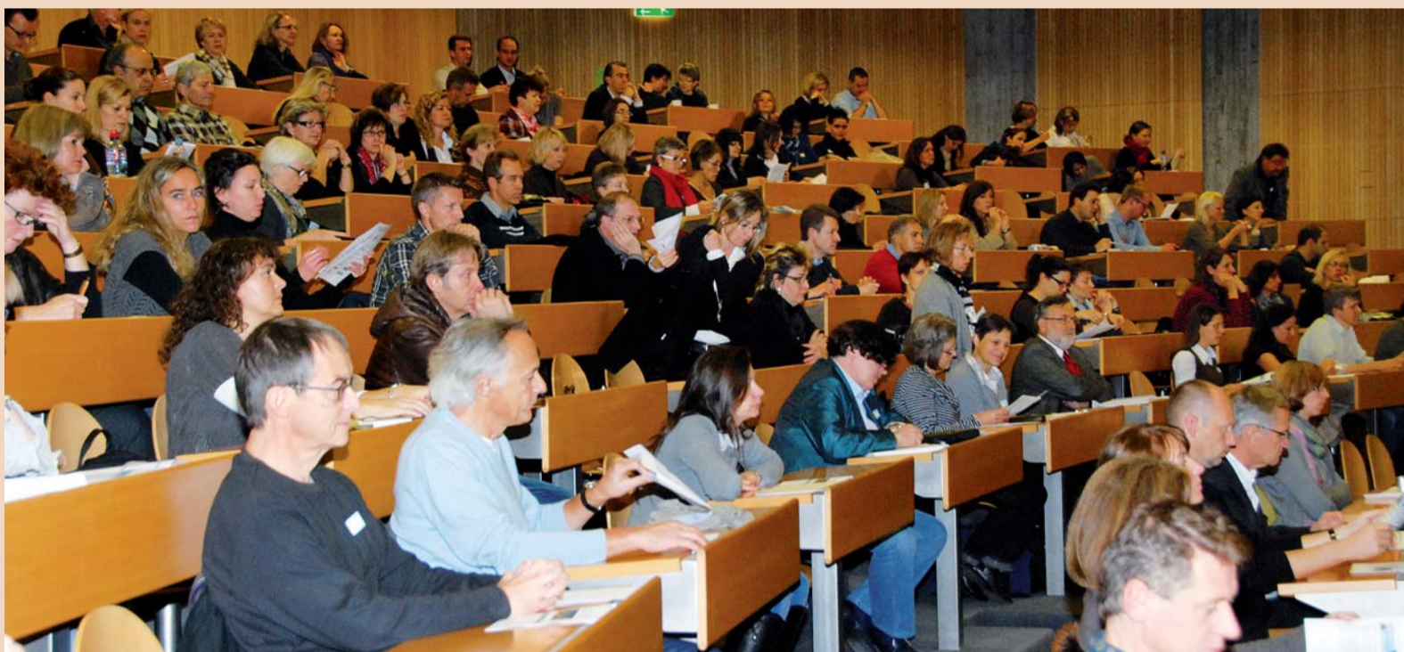
Über 250 Gäste, darunter etwa die Hälfte Dentalhygienikerinnen, verfolgten die Vorträge.