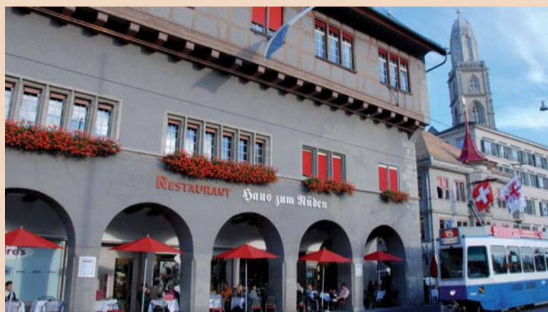
After Work Apéro im „Haus zum Rüden“, Zürich.