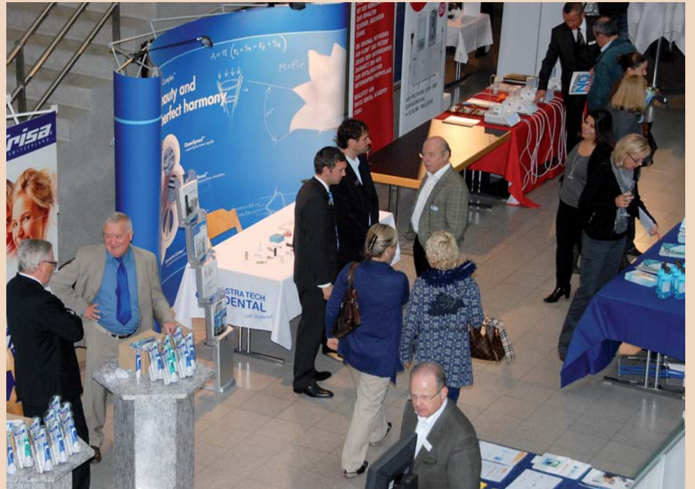
Industrie und Handel waren mit 15 Firmen vertreten.