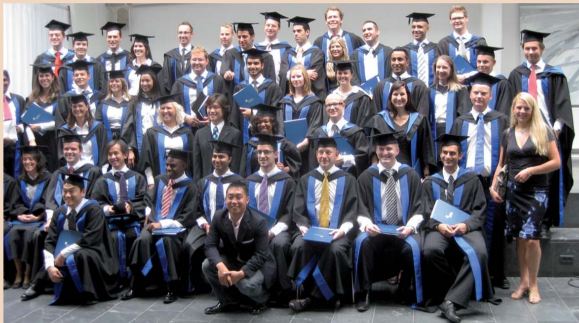
Absolventen der Klasse 2010

Das ist mein Erfahrungsbericht, der natürlich total befangen ist. Fragt man fünf andere Zahnmedizin-MBAler (mehr gibt es wahrscheinlich nicht), erhält man fünf weitere Meinungen. Sicher ist jedoch, dass ich jetzt wesentlich besser informierte Strategieentscheidungen und Investitionsplanungen fällen sowie Marketingaktivitäten verstehen kann. [1]