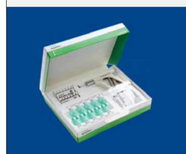
GUTTA FLOW 2