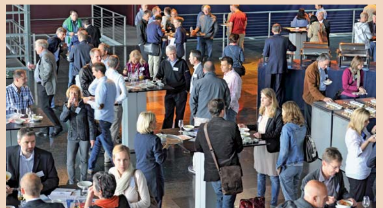
150 Teilnehmer fanden sich am 25. und 26. Mai zum Schmerz-Update im KKL Luzern ein.

schmerzen nach einer Nervdurchtrennung (Wurzelkanalbehandlung, Zahnextraktion) auf. Forscher berichten, dass in 7 bis 12 Prozent nach adäquat durchgeführter Wurzelkanalfüllung persistierende Schmerzen bestehen können. Überraschenderweise liegen die Zahlen bei Weisheitszahnextraktionen deutlich tiefer. In der Diskussion empfahl Dr. Ettl zur Behandlung von lokal persistierenden Schmerzen die Injektion von einem Gemisch aus einem Lokalanästhetikum mit einem kristallinen Steroid (Kenacort 10 mg/ml). Die Medikamentenapplikation kann im Abstand von ein bis zwei Wochen wiederholt werden. Bei eher diffusen Schmerzen empfiehlt sich der Einsatz eines trizyklischen Antidepressivums in niedriger, langsam steigender Dosierung (10 bis 50 mg).