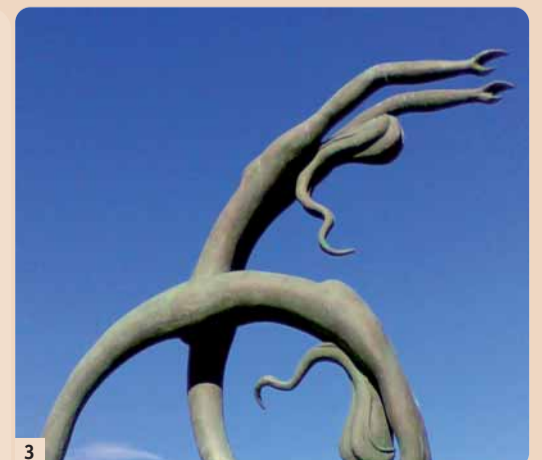
Das weibliche Schlankeitsideal künstlerisch dargestellt. (Skulptur: Hafenpromenade in Heraklion, Kreta.)