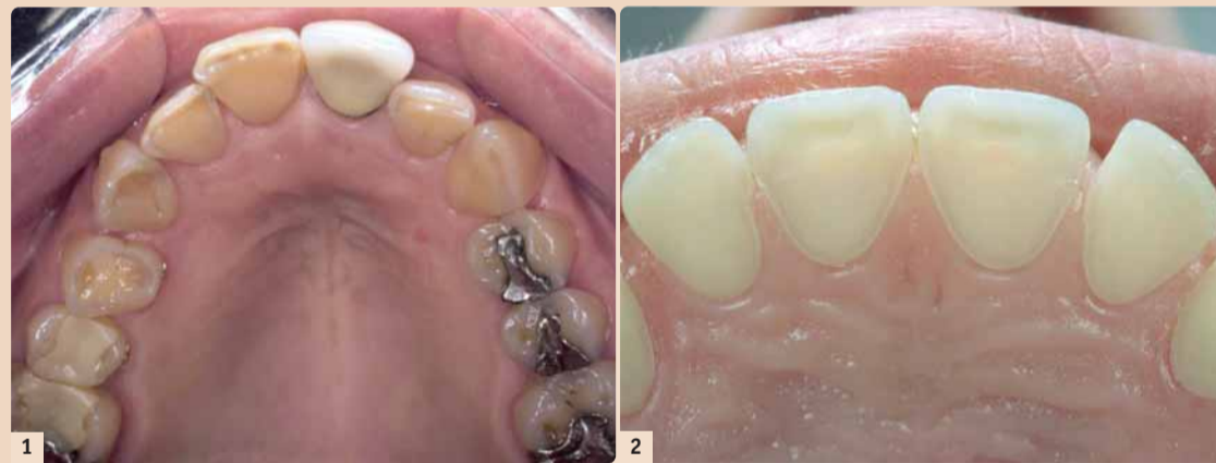
Abb. 1: Oberkiefer eines 29-jährigen Mannes (!) mit einer jahrelangen Essstörung. – Abb. 2: Das Bild zeigt eine ca. 25-jährige Frau mit massiven Substanzverlusten an den Palatinalflächen am Oberkiefer, sodass bereits die Pulpa rosa durchscheint.

Das Leiden beginnt bei Frauen (selten auch bei Männern) meist in den Pubertätsjahren (mittleres Al-