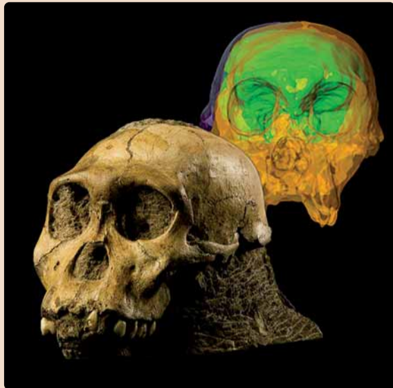
Schädel MH1 von Australopithecus sediba (Original) mit der virtuellen Präparation des Hirnraums im Hintergrund.

„Zusammenfassend kann man Sediba als eine ideale Zwischenform zwischen mehr affenähnlichen Vorläufern, wie der berühmten Lucy, und dem Menschen, dem Homo, einordnen. Man könnte ihn aber auch als Seitenlinie betrachten – dann wäre allerdings die Vielzahl an menschlichen Eigenschaften parallel entstanden, was eher unwahrscheinlich erscheint“, so Anthropologe Peter Schmid. Weitere Forschungen werden sich