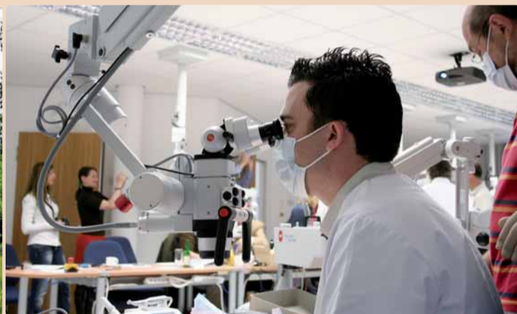
VDW Schulungszentrum München.

Die Zahnerhaltung durch endodontische Behandlung hat in den letzten Jahren in Deutschland und Europa erheblich an Stellenwert gewonnen. Während früher die Endo bei vielen Kollegen eher stiefmütterlich behandelt wurde, spezialisieren sich heute immer mehr Zahnärzte auf dieses Fachgebiet und mehr Allgemeinzahnärzte führen endodontische Behand-