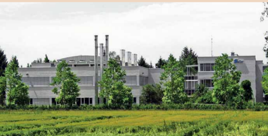
VDW Werk München.

Ganz einfach: Zähne erhalten, für ein Leben lang – was kann ein Zahnarzt besseres leisten?