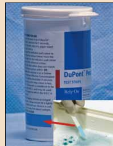
Test utilizzato al fine di verificare l'efficacia del prodotto decontaminante. (Rely+On Peracilyse Test Strip, www.medicaline.it)

Un'istruzione operativa deve indicare le azioni di seguito descritte, preliminari alla fase di sterilizzazione vera e propria.