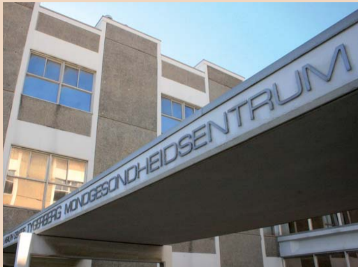
Wydział Stomatologii UWC oferuje wiele programów kształcenia podyplomowego.