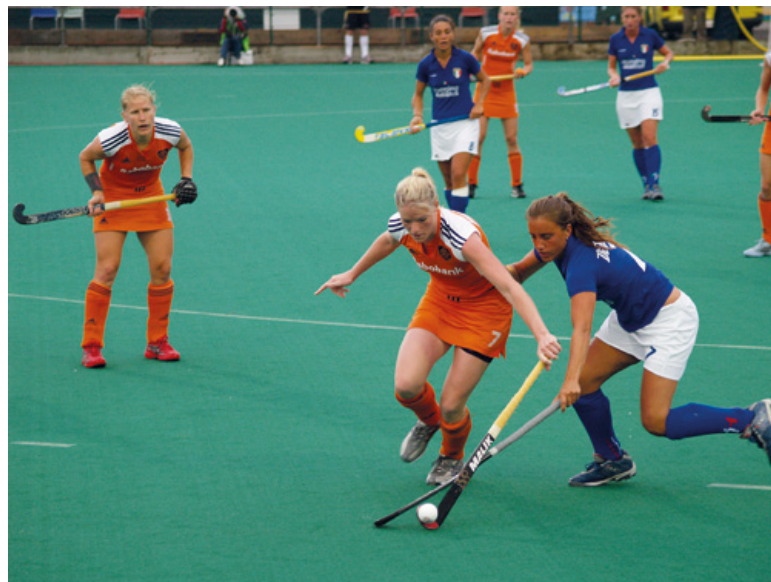
De Nederlandse hockeydames in actie tegen het nationale team van Italië in de zomer van 2007.

De Taskforce adviseert hockeyers te kiezen voor een individueel, door de tandarts of tandtechnicus vervaardigd bitje. Spelers kunnen echter ook kiezen voor een goedkope 'boil and bite'-bitje, verkrijgbaar bij sportwinkels. De komende periode organiseert de KNHB een campagne om de maatregel onder haar leden bekend te maken. (bron: KNHB) ■