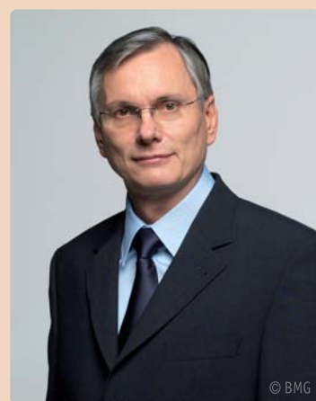
Bundesgesundheitsminister Alois Stöger.

Zur Sanierung der defizitären Kassenambulatorien hat das BMG vor wenigen Wochen dem Minister rat den Vorschlag vorgelegt, dass diese auch „Privatleistungen“, also z. B. Implantatversorgungen, Brücken etc. erbringen und mit dem Versicherten privat abrechnen können. Ausgenommen sollen nur „Luxusversorgungen“ sein, ohne dass diese gesondert definiert sind, sodass jedem Ambulatoriumschef die Festlegung von „Luxus“ überlassen bleibt.