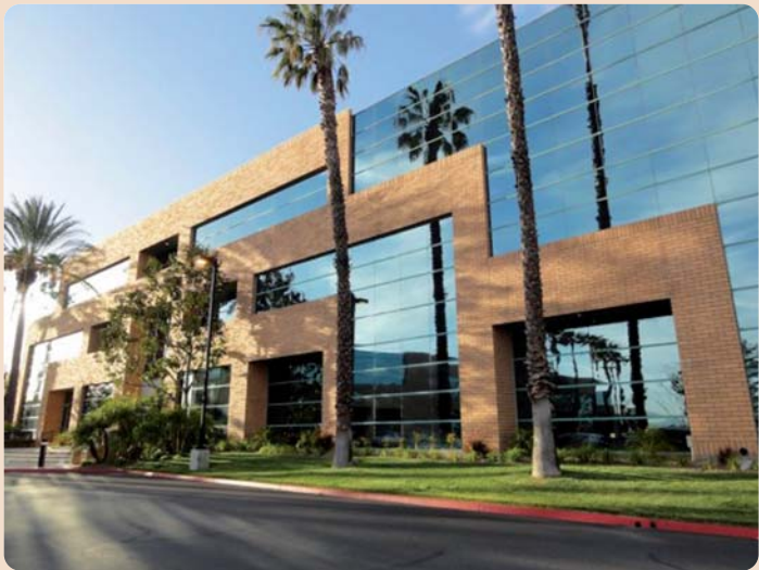
Neues Büro von 3Shape, Rancho Cucamonga, bei Los Angeles, Kalifornien.

Verbesserte Dienstleistungen von 3Shape für wachsenden Kundenstamm in Kalifornien.