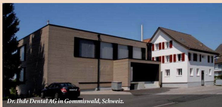
Dr. Ihde Dental AG in Gommiswald, Schweiz.