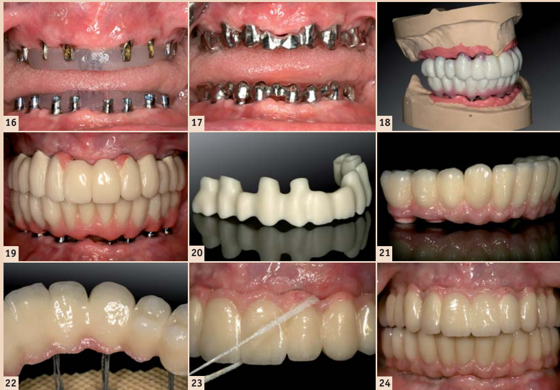
Abb. 16: Implantatabutmenteinprobe für Langzeitprovisorium (Therapeutikum). – Abb. 17: Gerüststeinprobe für Langzeitprovisorium (Therapeutikum). – Abb. 18: Wachsaufrichtung der Ober- und Unterkieferzähne für die Ästhetikeinprobe. – Abb. 19: Kunststoffverblendete Langzeitprovisorien (LZP) auf Metallbasen zur muskulären Kiefergelenkadaptation, vor der Herstellung des definitiven implantatgetragenen Zahnersatzes. – Abb. 20: CAD/CAM-generiertes Zirkon-Brückengerüst aus demselben virtuellen Datensatz wie das LZP. – Abb. 21 und 22: Verblendete, vollkeramische Zirkonbrücken nach Fertigstellung im Labor. – Abb. 23 und 24: Vollkeramische OK- und UK-Brücken zementiert in situ.

Die gewonnenen Bilddaten werden in der Regel im DICOM-Format in die Planungssoftware der entsprechenden Systeme übertragen. Diese Software erlaubt es, Implantate unter Berücksichtigung der prothetisch vorgegebenen Situation und des vorhandenen Knochenangebotes optimal virtuell zu platzieren. Dabei kann auf die Ansicht der Bilddaten in drei orthogonalen Schichten axial, koronal und sagittal sowie in einer dreidimen-