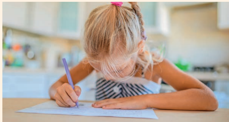
I volti scavati sono anche associati a overbite e mancini (foto: ©BestPhotoStudio/Shutterstock, a destra).