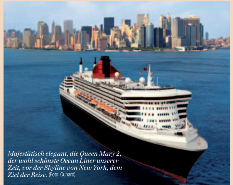
Majestätisch elegant, die Queen Mary 2, der wohl schönste Ocean Liner unserer Zeit, vor der Skyline von New York, dem Ziel der Reise.

Doch umsonst gab es den Preis nicht. Über 22 Fragen nach Arbeitstechnik, Material und der persönlichen Beurteilung des Handlings mussten beachtet und beantwortet werden. Insgesamt wurden über 100 Anwendungsbeobachtungen eingesandt – ein stolzes Ergebnis, wenn man bedenkt, dass in der Schweiz, Deutschland und Österreich über 1.600 Zahnärzte teilgenommen haben.