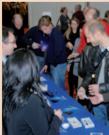
Die Pause wurde für Produkteinformationen genutzt.