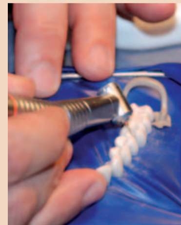
Prof. Krejci demonstriert die Nachpräparation des Schmelzrandes.

ausreichende Energiedosis – oft wird Leistung und Energie verwechselt. Diese wird in Joules (Energie) angegeben und entspricht der Wattzahl (Leistung) pro Sekunde, bezogen auf die Fläche in cm 2 . So ist heute allgemein akzeptiert, dass zur Lichtpolymerisation etwa 16 Joules/cm 2 nötig sind, d.h. 20 Sekunden bei 800 mW, 10 Sekunden bei 1.600 mW. Nach den Grundlagen stieg Prof. Krejci in die praktische Anwendung der Polymerisationslampen nach heutigem Wissensstand ein.