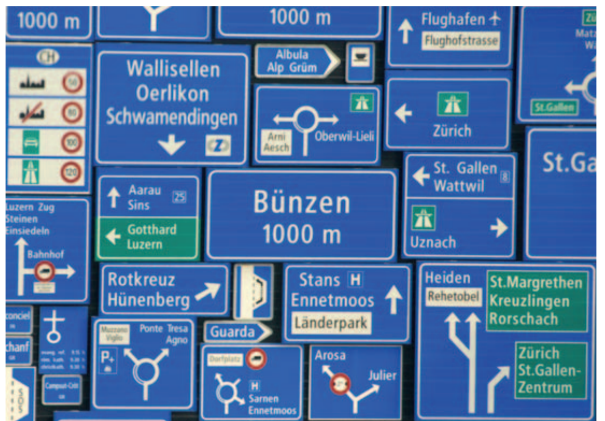
Welche Wege führen zu stabilen Gewebeverhältnissen – das Osteology Symposium im Verkehrshaus gab die Richtung vor.

tion der bukkalen Wand verhindert werden, durch den neugebildeten Knochen wird aber der Volumenverlust kompensiert und so die Dimensionen des Alveolarkammes erhalten.