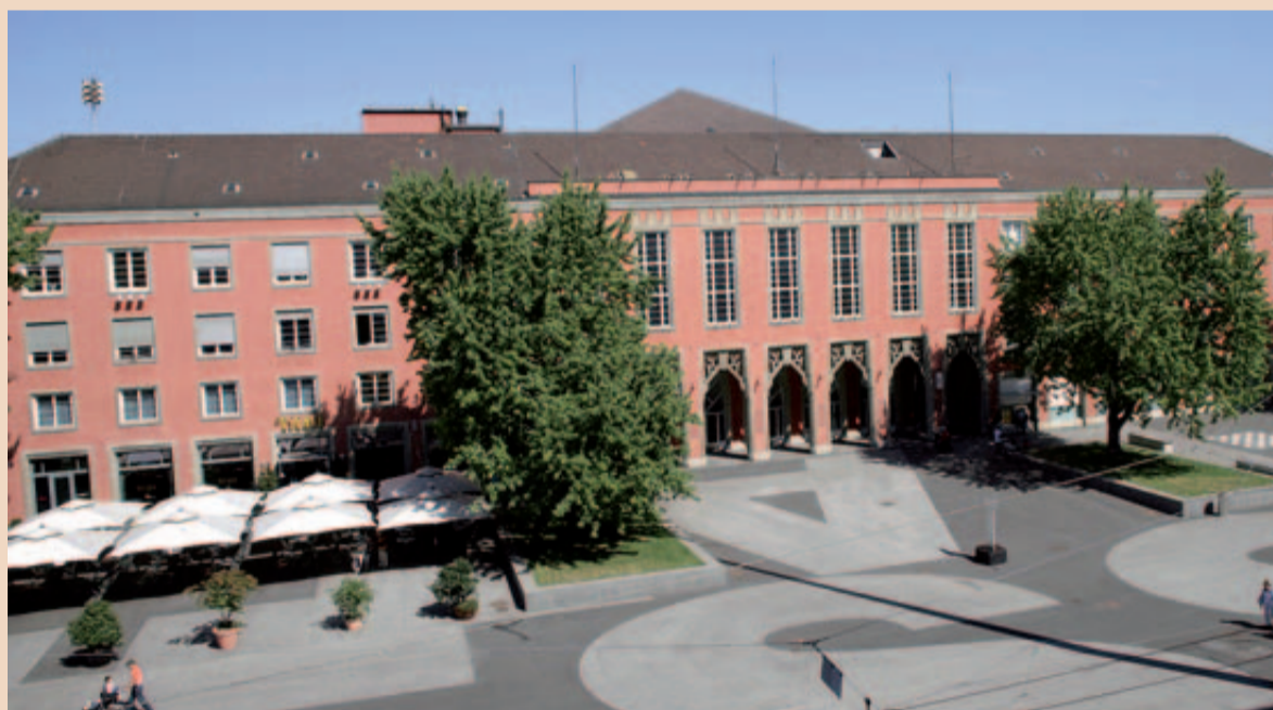
Eingang zur Halle 1 der Messe Basel mit grossem Festsaal. Hier tagt der SSO Kongress. Im selben Gebäude, im Saal Luzern, tagt die SGDMFR, Schweizerische Gesellschaft für Dentomaxillofaziale Radiologie.