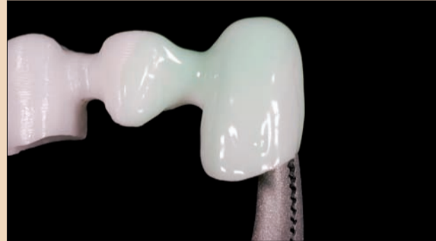
Şekil 3. Glaze tabakasına benzer IPS e.max Ceram ZirLiner uygulaması