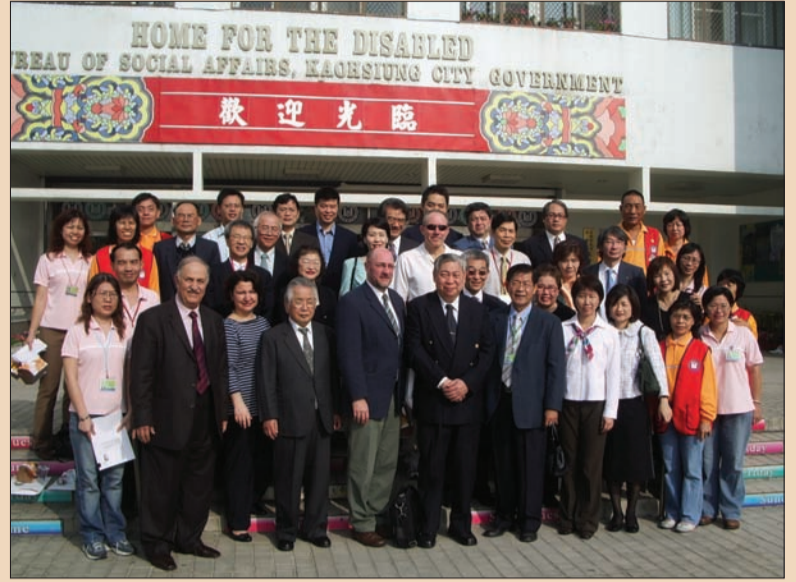
Koahsiung Üniversitesi Dişhekimliği Fakültesi Pedodonti Bölümü'nde ayrıca engelliler kliniği oluşturulmuş orayı ziyaret etti. Gruptan bir fotoğraf.

Ağız-diş sağlığı alanında Türkiye'de engellilere yönelik birbirinden habersiz olarak pek çok çalışma yapılıyor. Ülke geneline hitap eden bir çalışma mevcut değil. Fakültelerde genellikle pedodonti uzmanı olan değerli akademisyenler engellilerle ilgili bilimsel çalışmalar yapıyorlar. Ama bunları bir araya getirmek, derlemek gerekiyor. Bunun yanında devletin engelliler adına yaptığı güzel çalışmalar var. Başbakanlığa doğrudan bağlı