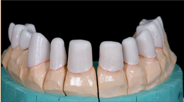
Şekil 2. Zirkonyum oksit kopinglerin başlangıç durumu