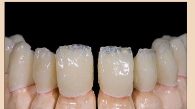
Şekil 7. İlk fırınlama sonrası görünüm