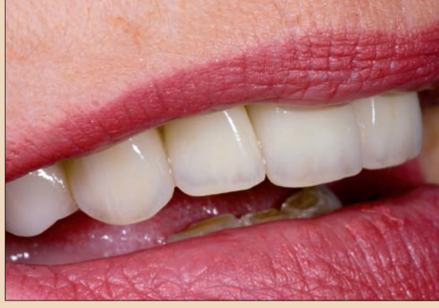
Şekil 12 ve 13. Tamamlanmış zirkonyum oksit restorasyon hasta ağızında. Restorasyon doğal ortamla gayet ahenkle kaynaşmış halde ve son derece canlı. Homojen seramik sayesinde gingival dokular çok sağlıklı görünüyor.