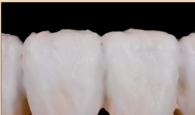
Şekil 8. Transpa Neutral, Transpa Clear ve Incisal 1,2, Transpa Incisal 1 ile yapılan yığmanın yakın görünümü