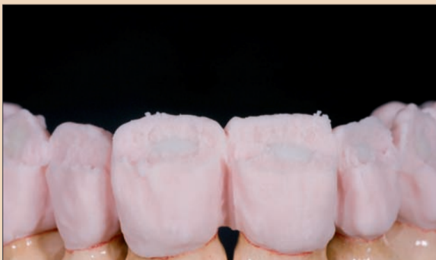
Şekil 5. İnsizal cut-back. Kalınlık kontrolü için zirkonyum oksit kopingin reduksiyonu