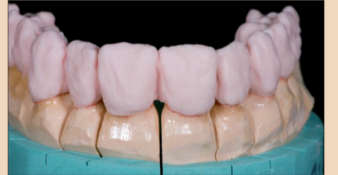
Şekil 4. Dişin IPS e.max Ceram Dentin ile temel yığımı