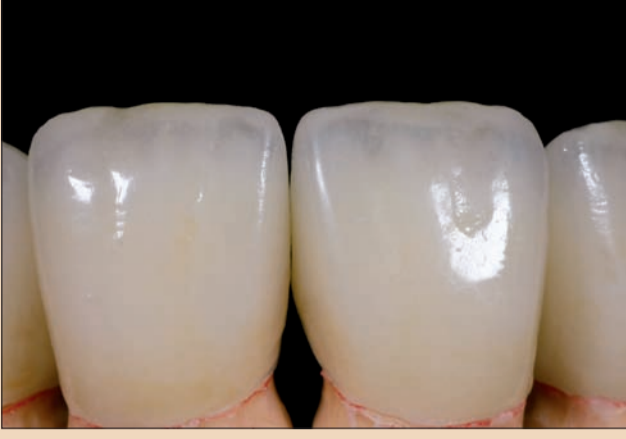
Şekil 11. Restorasyonun yakın çekim görüntüsünde homojen yüzey belirgin haldedir