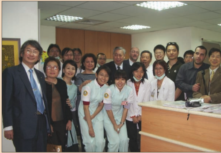
Engelliler evinde 2 üniteli diş kliniği açılışı yapıldı.

Organizasyonun amacı kendi ülkelerinin ve diğer ülkelerin deneyimlerini ortak bir platformda buluşturup paylaşarak yapılması gerekenleri belirlemektir. Bizden başka Amerika, Kanada, Norveç, Belçika, Japonya, Avustralya, Tayland, Ürdün, Sri Lanka, Filipinler, Moğolistan, Kore'den temsilciler vardı. Ben de bu alanda ülkemizde ve de TDB'de nelerin yapıldığını aktarmaya çalıştım. DT