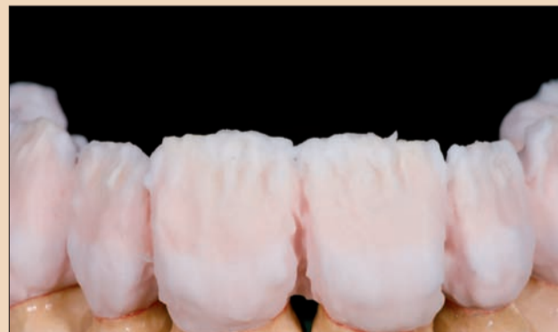
Şekil 6. Efekt materyalleri Opal Effect 1-3, Transpa Blue ve Mamelon Light ile tekrar yığılan cut-back sahası