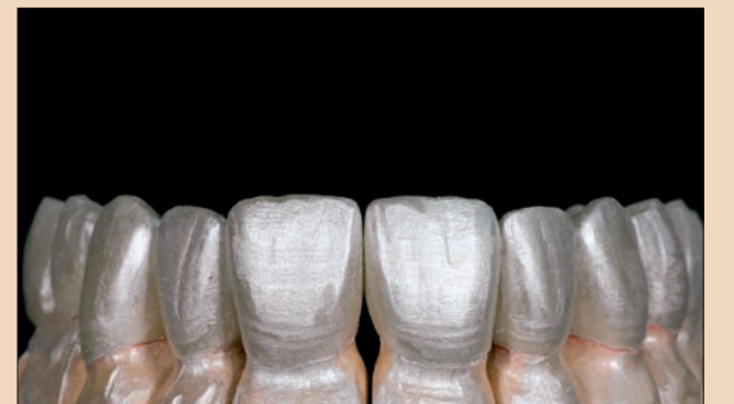
Şekil 10. Gümüş tozu yardımıyla anatomik şeklin kontrolü