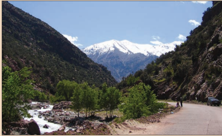
Atlas dağlarının görünümü

Yedi günlük macera katılımcılara aynı zamanda renkli ve canlı bir şehir olan Marakeş'i keşfetme fırsatı da sunacak. Hayat dolu bir şehir olan Marakeş, Toubkal tepesinin huzuruna tam bir tezat teşkil eder. Grubun tatlı bir telaş içindeki egzotik ortam-