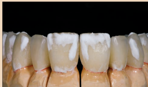
Şekil 9. İlave fırınlaması için hazır, Incisal 1 ve 2 ile üretilen restorasyonlar