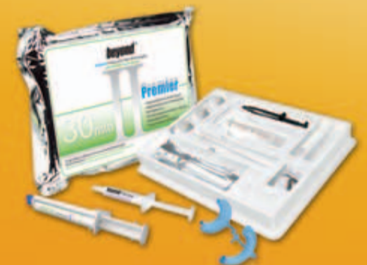
BEYOND™ Premier™ mit RENEW Touch-up Whitening Gel