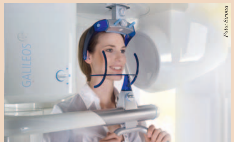
Die digitale Volumentomografie (DVT) bringt eine Vielzahl von Vorteilen für Behandler/-in und Behandelte/-en mit sich. Das digitale Röntgengerät GALILEOS Comfort von Sirona.