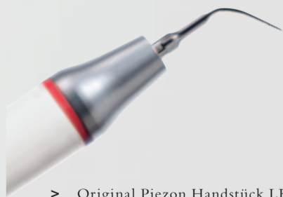
> Original Piezon Handstück LED mit EMS Swiss Instrument PS

Praktisch keine Schmerzen für den Patienten und maximale Schonung des oralen Epitheliums – grösster Patientenkomfort ist das überzeugende Plus der Original Methode Piezon, neuester Stand. Zudem punktet sie mit einzigartig glatten Zahnoberflächen. Alles zusammen ist das Ergebnis von linearen, parallel zum Zahn verlaufenden Schwingungen der Original EMS Swiss Instruments in harmonischer Abstimmung mit dem neuen Original Piezon Handstück LED.