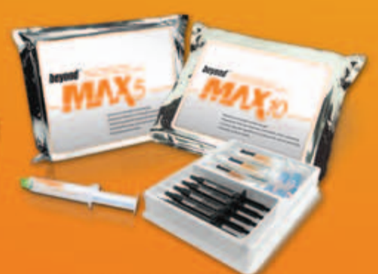
BEYOND™ Max5™ and Max10™ Behandlungskits