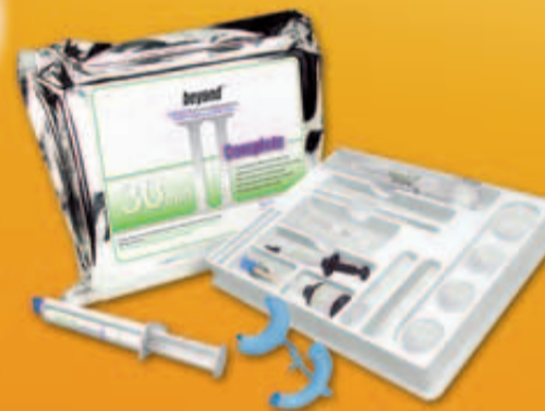
BEYOND™ Complete® für Tetrazyklin und schwierige Verfärbungen

Kontaktieren Sie uns heute, um mehr über Produkte und Vertriebsmöglichkeiten in Ihrer Nähe zu erfahren!