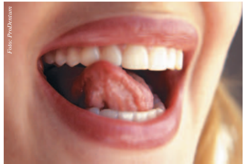
Abb. 1: Zahnlücken müssen nicht sein – ein ästhetisches Erscheinungsbild ist bei allen Patienten/-innen möglich.

„P“ umfasst die ästhetisch aufwendig hergestellte Kompositrestauration, Inlays, Onlays und Kronen aus polychromatischen Silikatkeramikblö-