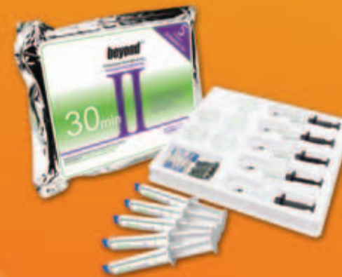
BEYOND™ Behandlungskit für 5 Patienten