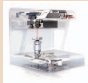
Abb. 2: Schematische Darstellung des neuen NobelProcera™-Systemscanners, basierend auf einer lichtoptischen Objekterfassung mittels konoskopischer Holografie.

Faktor ist, dass scharfen Kanten und Übergänge vermieden werden sollten, um punktuelle Belastungsspitzen bei Kräfteinleitung zu unterbinden. Auch diese Aspekte werden im NobelProcera™-System berücksichtigt und unterstützen den/die Anwender/-innen durch eine automatische Anpassung der Form bei Veränderun-