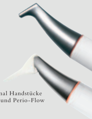
> Original Handstücke Air-Flow und Perio-Flow

Und wenn es um das klassische supra-gingivale Air-Polishing geht,