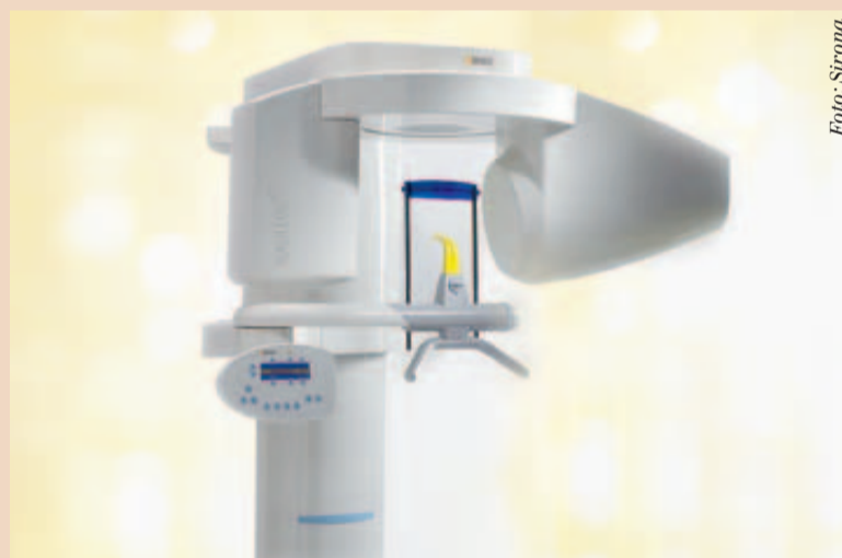
Digitales Röntgen bietet durch seine hohe Schärfe sichere und aussagekräftige Aufnahmen, wie etwa das Gerät GALILEOS Compact.

Digitales Röntgen benötigt weder Dunkelkammer noch Chemie und erspart Ihnen den bekannten Aufwand und die Pro-