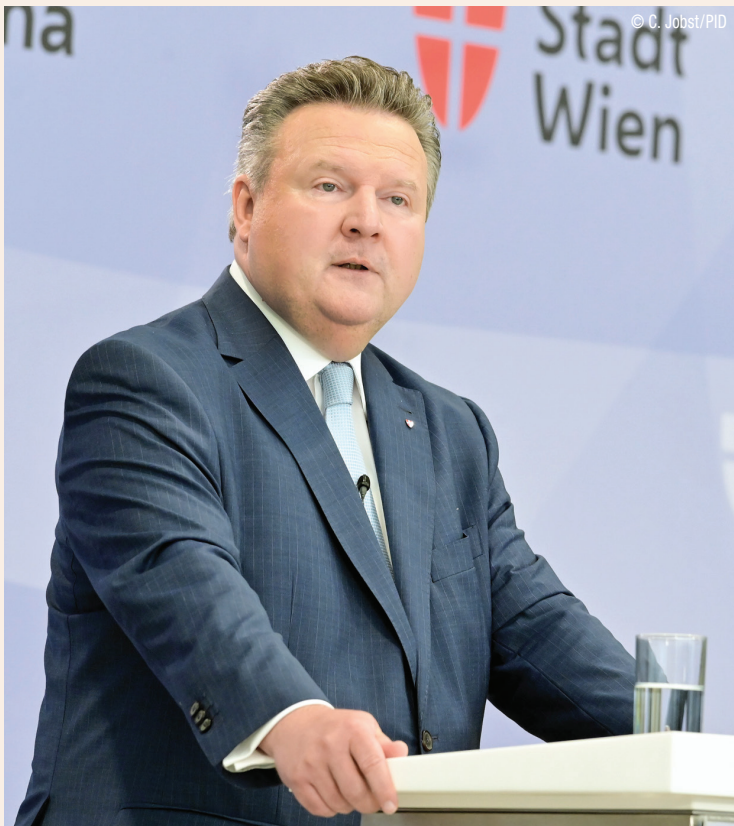
Wiens Bürgermeister Michael Ludwig im Festsaal des Rathauses.

WIEN – Die Stadt Wien wird auch nach den bundesweiten Lockerungsschritten am 5. März bei ihrer strengeren Linie in Sachen Coronamaßnahmen bleiben. Das bekräftigte Bürgermeister Dr. Michael Ludwig am Rande eines Pressterrmins am 1. März – betroffen sind etwa die 2G-Regel in der Gastronomie und die Masken-