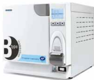
Euronda klasse B autoclaaf E9 Recorder

Praktijkhygiëne is een zeer actueel onderwerp.