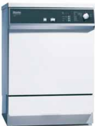
Miele thermodesinfector G7881