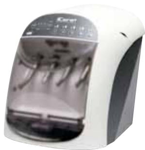
NSK systeem voor reiniging, desinfectie en smering iCare+