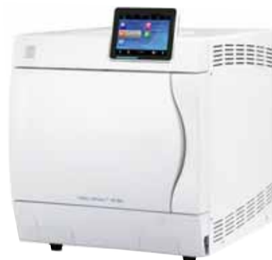
Melag klasse B autoclaaf Vacuklav 41B+