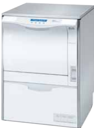
Melag thermodesinfector MELAterm 10