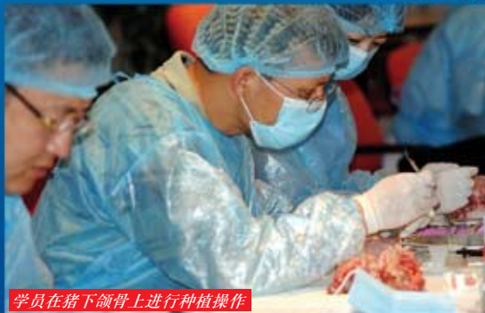
学员在猪下颌骨上进行种植操作