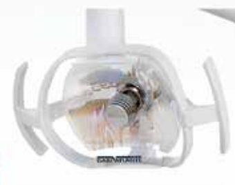
REFLECTOR REFLEX LD CON LÁMPARA HALÓGENA O LED

Para más informaciones y presupuesto: LUCIA.BERNARDI@DABIATLANTE.COM.BR