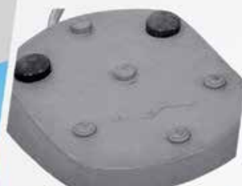
PEDAL DE COMANDO con vuelta a cero, tres posiciones de trabajo y control de intensidad del reflector.