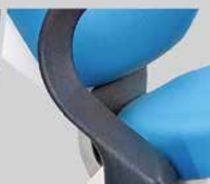
ARTICULACIÓN CENTRAL ÚNICA