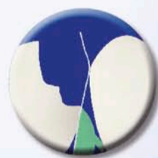
Punto di contatto di forma convessa