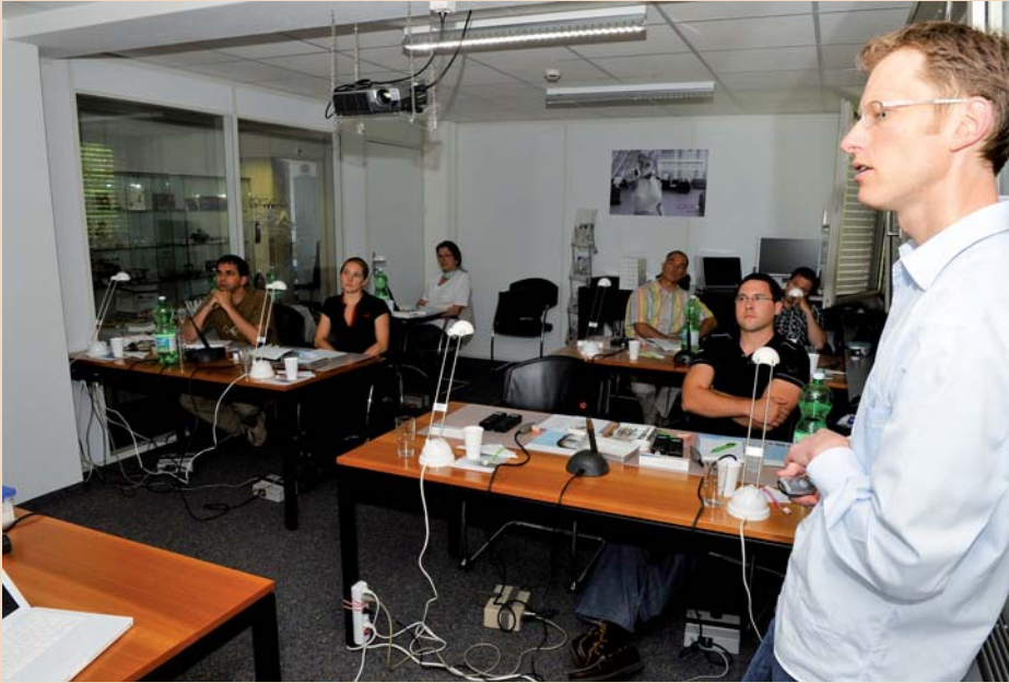
Der neue Kursraum bei Heraeus in Dübendorf.