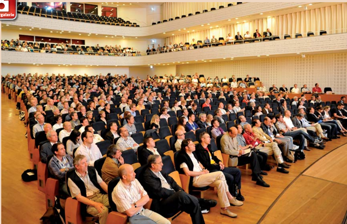
Der Festakt im Konzertsaal des KKL war gut besucht.