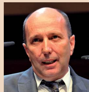
Nationalratspräsident Jean-René Germanier überbrachte die Grussbotschaft des Bundes.