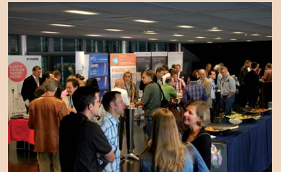
Blick in die Industrieausstellung.