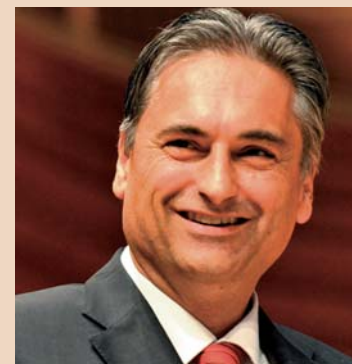
Guido Graf, Regierungsrat Kanton Luzern