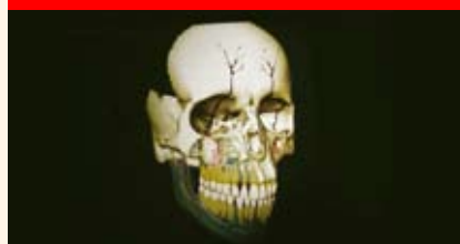
Centro multimedia de UNAM, un ejemplo para Latinoamérica Páginas 12 y 13