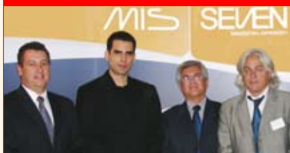
I Simposio Centroamericano de Implantes MIS Página 20