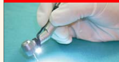
Novedades de Vita, E-WOO, Forestadent, e Introlight Páginas 28, 29 y 30