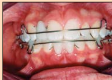
Slika 5. Ortodontski Hawley retineri sa dentalnim nadoknadama korišćeni u prelaznom periodu između skidanja aparata i cementiranja fiksnih nadoknada.