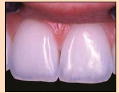
Slika br. 18 - Tipični opalescentni efekat sa plavičastim haloom u incizalnoj regiji i opalescencijom u srednjoj trećini zuba.

Opalescencija zuba uzrokovana je malim partiklima