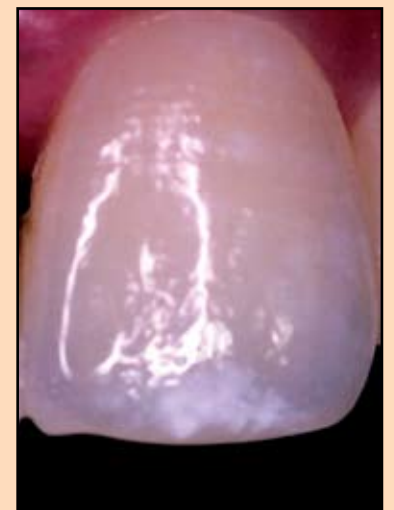
Slika br. 20 - Tipični opalescentni efekat gleđi. Na fotografiji se vidi tipičan plavičasti halo okružen sa opalescentnom gleđi. U incizalnoj trećini postoji intenzivna mrlja na gleđi, a cela površina je pokrivena sa beličastim pahuljičastim opalescencijama.

u translucentnoj gleđi koji reflektuju i rasipaju svetlost tj. manje talasne dužine se reflektuju i prave plavičast odsjaj zuba. Kod prirodnih zuba ovo se obično pojavljuje na ivicama incizalne trećine, gde uglavnom nema dentina i tu se pojavljuje poznati plavičasti halo oko zuba. Kako debljina dentina raste, to se više talasnih dužina reflektuje što utiče na pojavu sivkastog do beličastog odsjaja. (slika 21.)