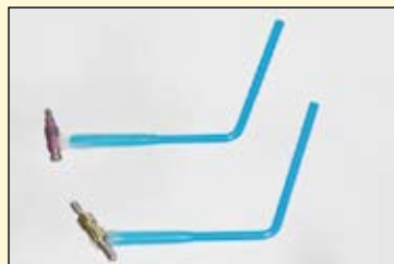
图3, 示范的是如果利用粘接棒将闭合和开放的种植体转移杆放置到需要弯曲粘接棒才能到达合适的位置。需要再次强调的是, 即使在放置种植体转移杆时, 在把他们拧紧在种植体上的过程中也是很容易滑落的。

图2, 示范的是将一个微型的用以固位的部件放置到一个微型ERA基台(Stern-gold, Atterbury, Massachusetts)。可以通过使用粘接棒来协助放置他们, 特别是在放置时特别容易滑落的后牙弓位置。