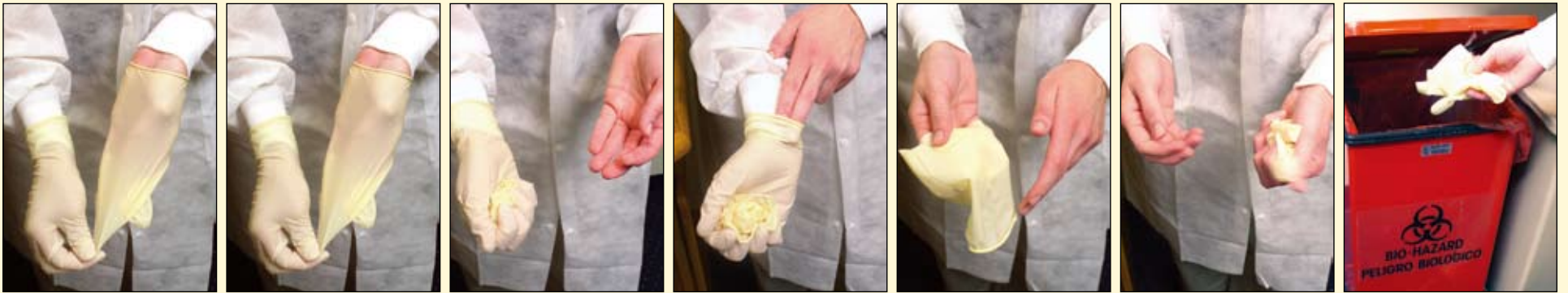
第一步：捏住左手手套的手掌侧，并向手指方向脱位。 第二步：继续拉左手手套的手掌侧，直到手指从手套内脱出。 第三步：左手手套脱下来之后，将其成团状放在右手的掌心。 第四步：左手的两个手指伸到右手手套手掌侧的边缘下。 第五步：用左手将手套向手指方向脱位，并包裹住团状的左手手套。 第六步：左手抓住手套，并从右手脱位。 第七步：将手套放置到感染性废物容器里，然后洗手。