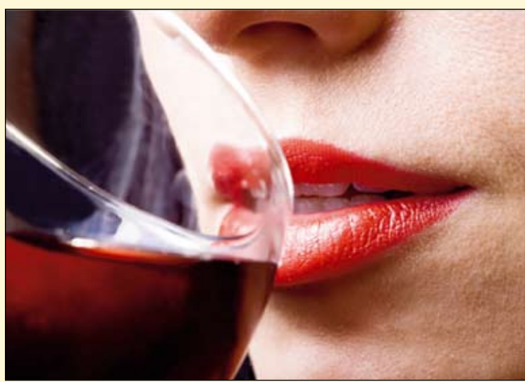
专业品酒师每天品尝的葡萄酒种类多达150种。

阿德莱德, 澳大利亚: 来自阿德莱德大学的最新研究表明, 如果葡萄酒爱好者不采取防止牙齿腐蚀的预防措施, 那么葡萄酒将会严重的损害他们的牙齿。根据出版在最新一期的澳大利亚牙科杂志中的文章指出, 牙釉质一旦暴露在有机酸饮料中, 最快10分钟就会出现脱矿化。