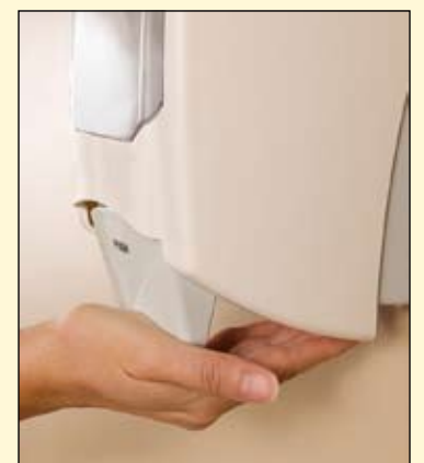
医护人员能够确保手部卫生的关键是要破坏微生物的传输途径，在病人接触之前以及在接触血液、体液或污染的表面（即使手套被磨损）后，侵入性操作前；脱掉手套后（手套是不足以防止病原体传播）都应该进行手部清洁。

患者每次就诊时医生都应该详细记录病历，这将有助于医生确定患者是否患有传染病。伴有咳嗽、发烧等呼吸道症状的患者，应该推迟其牙科治疗，直到他们不再有这些呼吸道症状时再行治疗。此外，有相应症状的医护人员应该暂时停止临床工作，直到他们24小时内