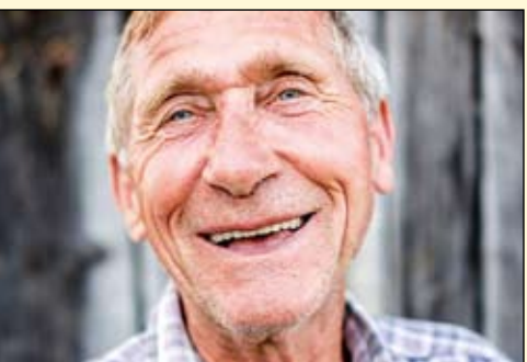
一项研究已经表明拥有牙齿数目多的老年人拥有更长的寿命。

“研究结果表明保留更多牙齿数目对于长寿来说是有意义的一项指标。”调研人员总结到。DT