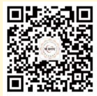
世界牙科论坛微信公众平台

《牙科世界》是国内第一款关于口腔医学信息的APP应用, 专门为口腔专业人员提供行业最新资讯, 学术文章, 教育培训, 病例讨论, 最新产品, 求职招聘等相关信息。