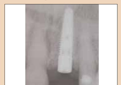
Fig. 2g: Radiografie postoperatorie a implantului în poziție ideală pentru restaurare.