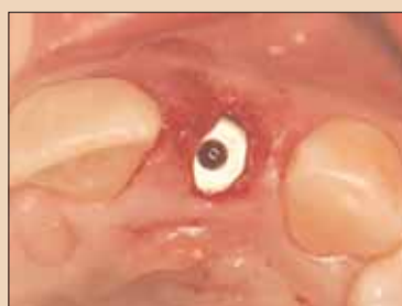
Fig. 3b: Introducerea implantului imediat după degranularea și detoxifierea alveolei.