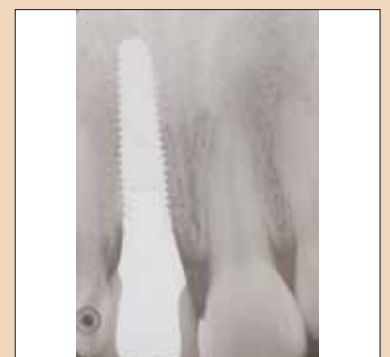
Fig. 1h: Radiografia restaurării finale reținute cu șurub UCLA