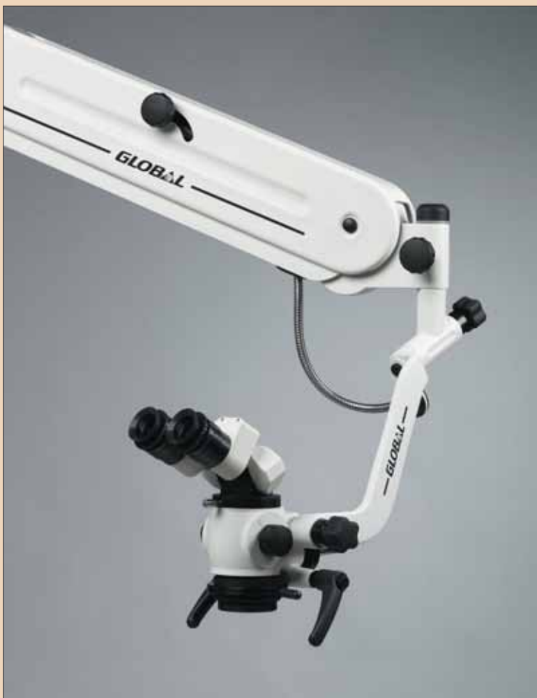
Fig. 1: Microscop chirurgical Global (Global chirurgicale, St Louis, MO, USA).

Un cititor mi-a trimis recent prin e-mail această întrebare: "Ai mai folosit un ac rotativ din NiTi 15 .02 (de exemplu, K3, Race sau Quantec) pentru a obține lungimea de lucru pe care ai fost în imposibilitatea de a o stabili cu ace de mână, de exemplu într-un canal MV2? Dacă da, care a fost experiența ta cu această tehnică?"