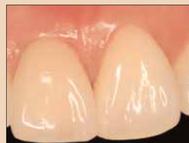
Fig. 1g: Estetică ideală de țesut moale obținută (restaurare realizată de Dr. Glenn Bickert).