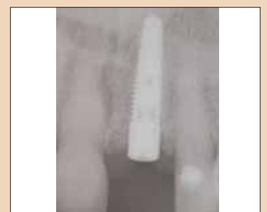
Fig. 2g: Radiografie postoperatorie a implantului în poziție ideală pentru restaurare.