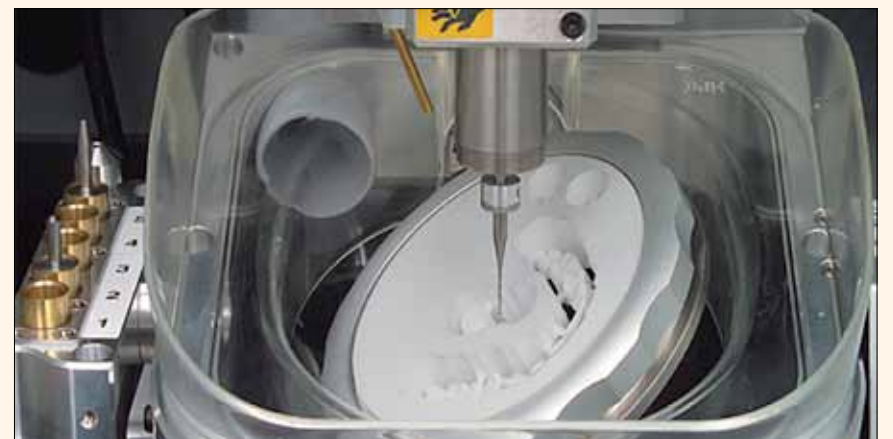
La línea de fresadoras DWX de Roland simplifican el proceso CAD/CAM y ahora aceptan resinas compuestas.

La compañía Roland DGA Corp., líder en tecnología CAD/CAM, anunció la disponibilidad de una tecnología opcional para las fresadoras dentales DWX-50 y DWX-4 que permiten el fresado de materiales de resinas compuestas, incluyendo los bloques tipo pin para restauraciones CAD/CAM VITA ENAMIC® y 3M™ ESPE™ Lava™ Ultimate.