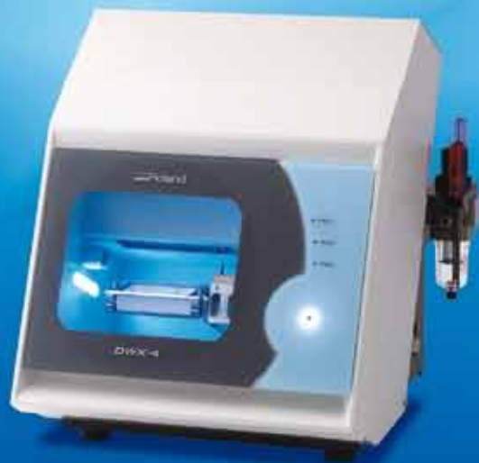
Fresadora Dental Compacta DWX Software CAM incluido