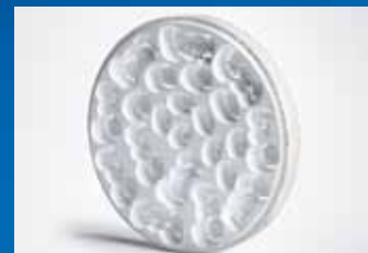
Fresa múltiples trabajos sin atender