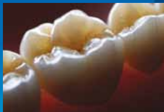
Coronas, pilares y puentes