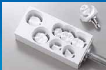
Bloques estándar y materiales tipo clavija