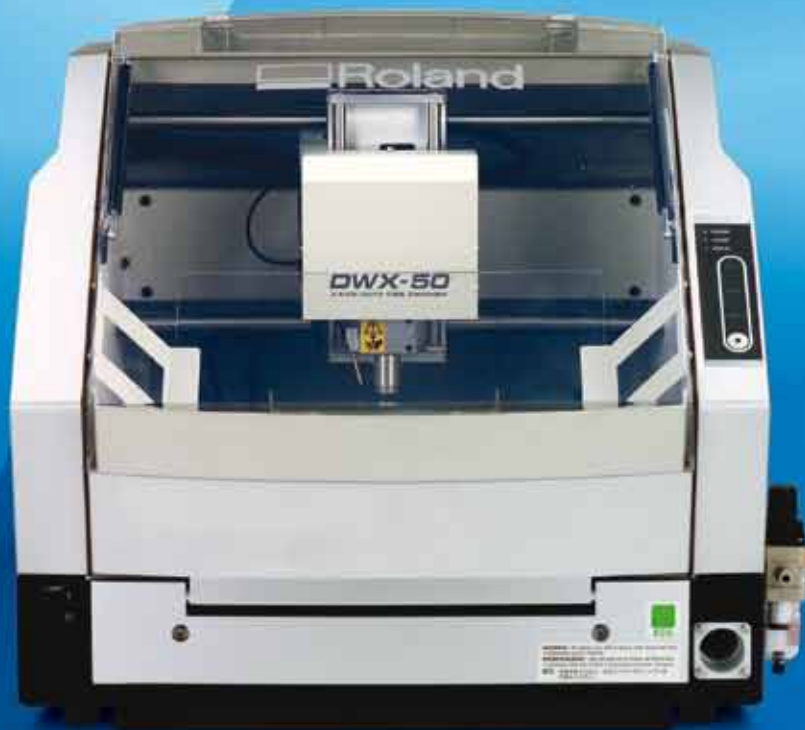
Fresadora Dental de 5 Ejes DWX