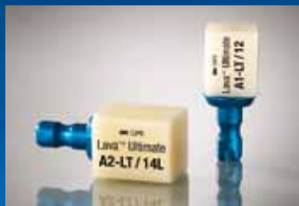
3M ESPE Lava™ Ultimate Restorative