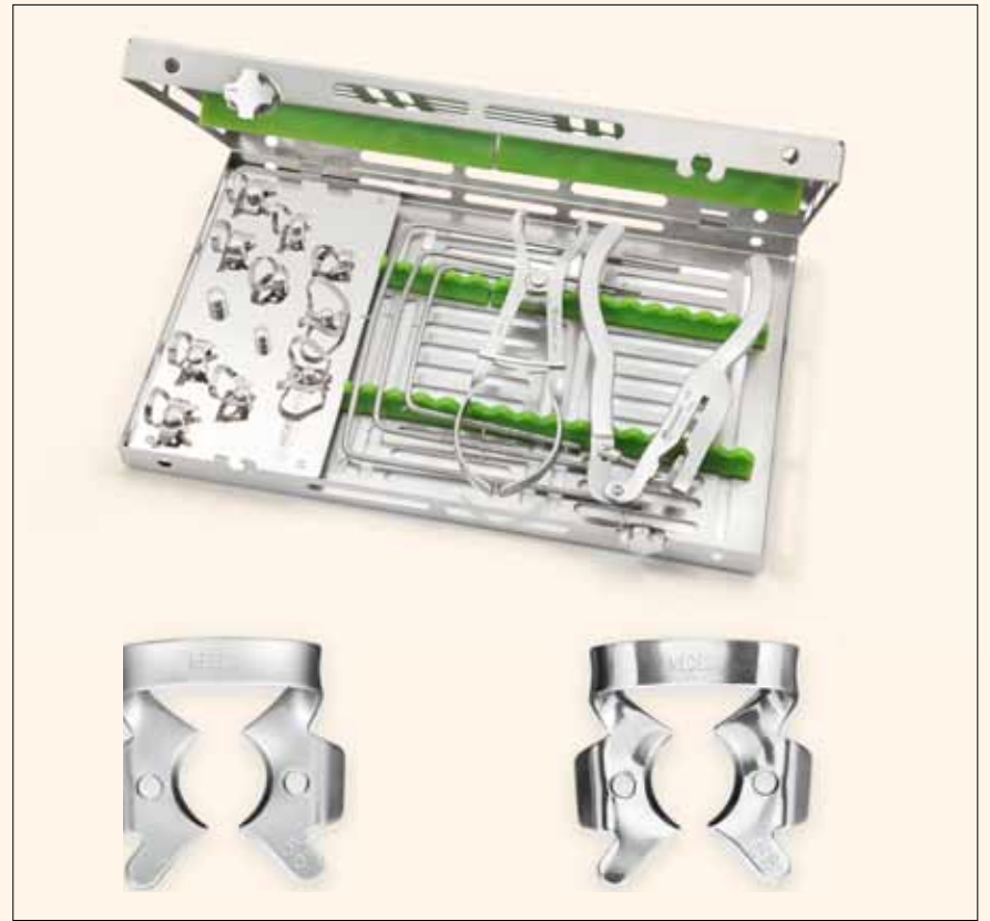
El estuche DENTAL DAM SET in GAMMAFIX TRAY de Medesy facilita el proceso de limpieza y esterilización.