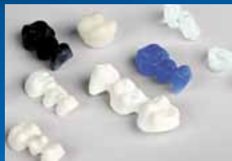
Cera, PMMA y zirconio