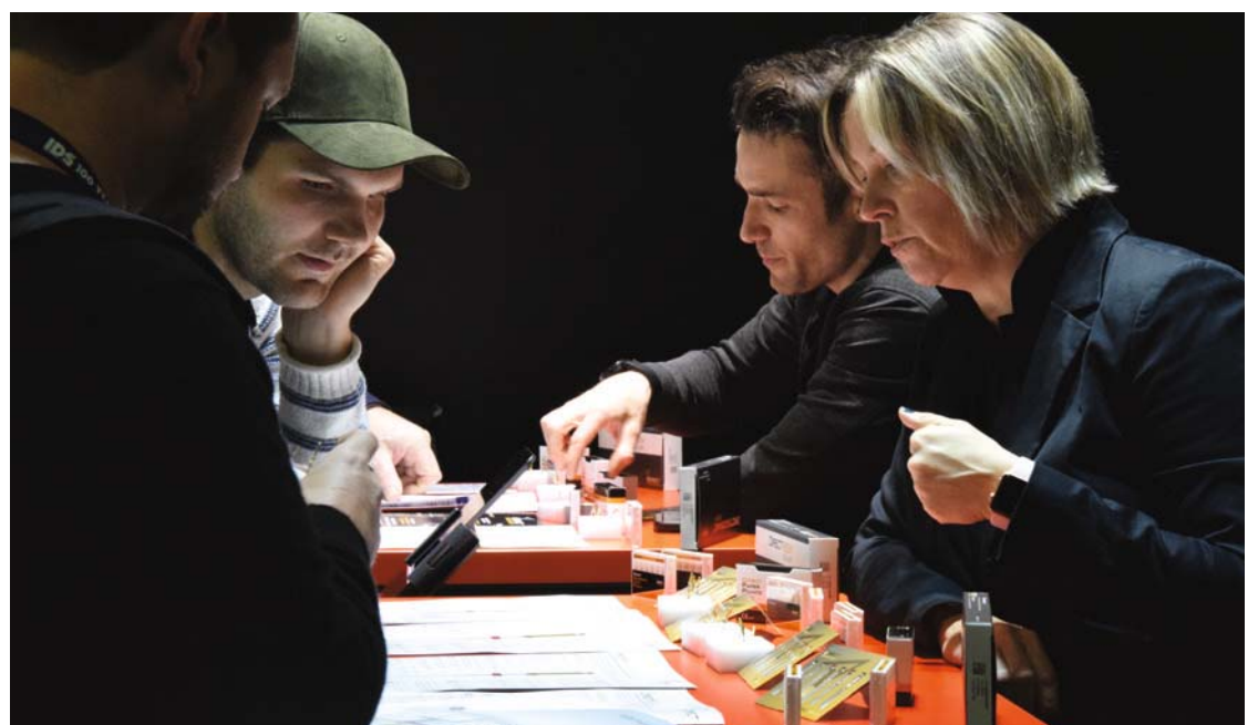
• IDS-Besucher informieren sich über die Produkte von DirectEndodontics auf der IDS. • IDS visitors learn more about DirectEndodontics' products at IDS 2023.

Bei oszillierenden und rotierenden Feilen ist dies meiner Meinung nach einfacher, da die Benutzer deren Leistung austesten und sie problemlos nachbestellen können. DirectEndodontics bietet eine Auswahl von vier unterschiedlichen oszillierenden und rotierenden Feilen. Ich habe gerne beide Optionen zur Hand, denn es kommt vor, dass ich lieber mit einem oszillierenden Instrument arbeite, und in anderen Fällen ist die Verwendung einer eher traditionellen rotierenden Feile schneller oder praktischer.