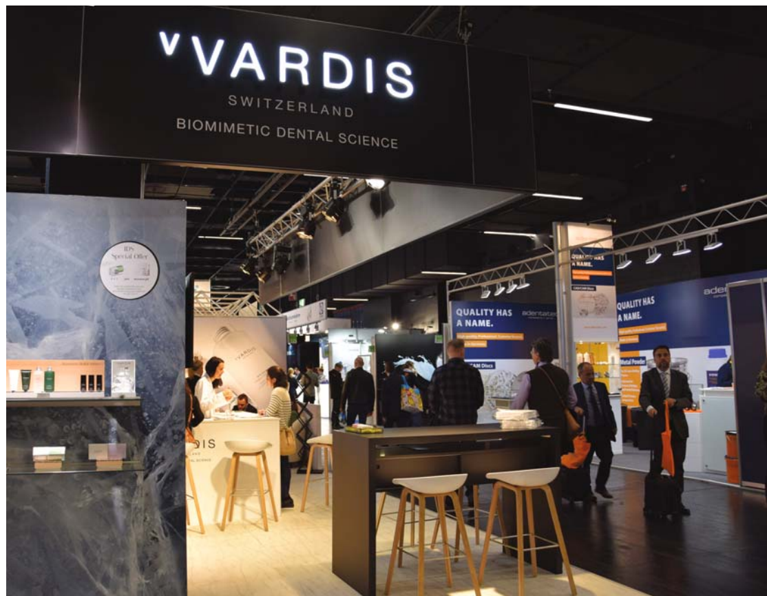
-Der vVARDIS-Stand (T021) ist in Halle 10.2 zu finden. -The vVARDIS booth (#T021) can be found in Hall 10.2.

Haleh: Das ist auch der Grund, warum wir neben unseren Kliniken eine eigene Dentalhygieneschule mit einem eigenen Forschungszentrum betrieben haben, in dem klinische Studien durchgeführt wurden. Vor mehr als zehn Jahren sind wir auf die revolutionäre Technologie von Curodont Repair gestoßen, eine schmerzfreie, nicht invasive Behand-