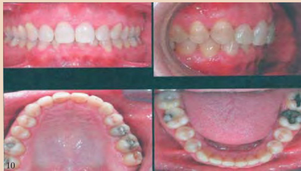
Εικ. 5 Ανωμαλία σήγλεισης πριν από τη θεραπεία: θεραπεία χωρίς εξαγωγές, οδοντοφατνιακή ασυμμετρία, τάση τρίτης τάξεως, παρέκκλιση της μέσης γραμμής. Εικ. 6 Τρισδιάστατες ενδοστοματικές εικόνες σε προσομοίωση των οδοντικών τάξεων με την ίδια ανωμαλία σήγλεισης πριν από τη θεραπεία και μετά το τελικό ClinCheck. Εικ. 7 Σύγκριση ενδοστοματικών εικόνων πριν και μετά τη θεραπεία-μιασηπτική άποψη. Εικ. 8 Σύγκριση ενδοστοματικών εικόνων πριν και μετά τη θεραπεία-ενδοστοματική άποψη δεξιά και αριστερά. Εικ. 9 Πριν από τη θεραπεία και πριν από τη διόρθωση στο μέσον της θεραπείας. Εικ. 10 Η διόρθωση στο μέσον της θεραπείας είναι σε εξέλιξη.