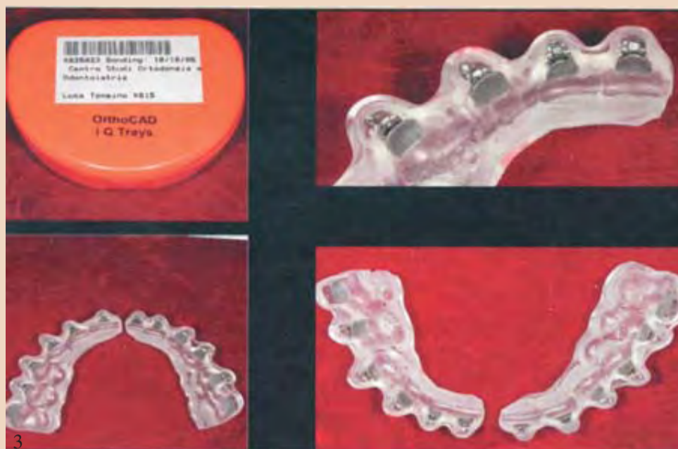
Εικ. 3 Δισκάρια άνω και κάτω με τα μπράκετς ευθέος σύρματος να έχουν τοποθετηθεί μέσα στα δισκάρια (πλαστικά εσωτερικά και άκαμπτα). Εικ. 4 Έμμεση διαδικασία συγκόλλησης.