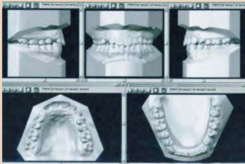
Εικ. 1 Πριν από τη θεραπεία.

Μία σημαντική ώθηση στη χρήση των ψηφιακών εκμαγείων εκφράζεται με την αποδοχή αυτής μεθόδου από τους επίσημους ορθοδοντικούς φορείς πριν από λίγα χρόνια. Τα τελευταία χρόνια, η σχεδίαση με τη βοήθεια υπολογιστή-CAD αλλά και η τεχνολογία κατασκευής με τη βοήθεια υπολογιστή-CAM εφαρμόζονται στην Οδοντιατρική και ιδίως στην Ορθοδοντική. Η τρισδιάστατη ορθοδοντική διάγνωση και ο προγραμματισμός της θεραπείας έχουν εισαχθεί στην ορθοδοντική