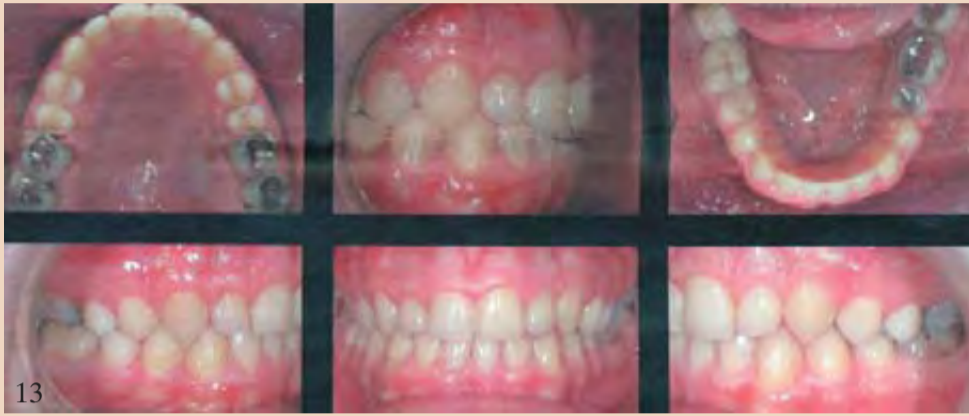
Εικ. 11 Πριν από τη θεραπεία. Εικ. 12 Πριν από την τελειοποίηση. Εικ. 13 Το τελικό αποτέλεσμα.

οδηγούς. Η συνεργασία του ασθενή είναι καθοριστικός παράγοντας για να έχουμε τέλεια αποτελέσματα ιδίως στην ορθοδοντική θεραπεία που γίνεται με συστήματα διευθέτησης. DT